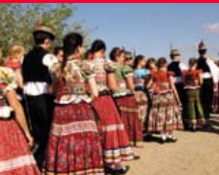
Mezőkövesd, Matyó örökség