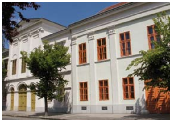
Fejér Megyei Levéltár