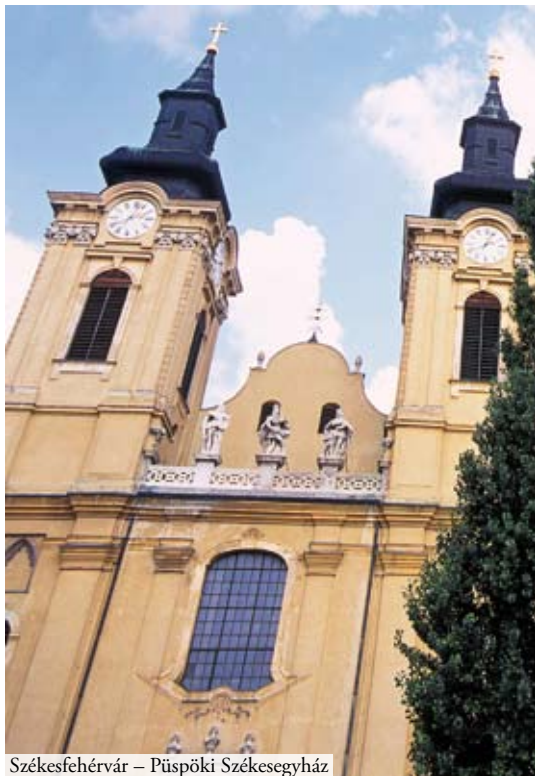
Székesfehérvár – Püspöki Székesegyház

A város legősibb, történeti magva, az első uralkodói szállás, Géza fejedelem palotájának helye a mai szé-