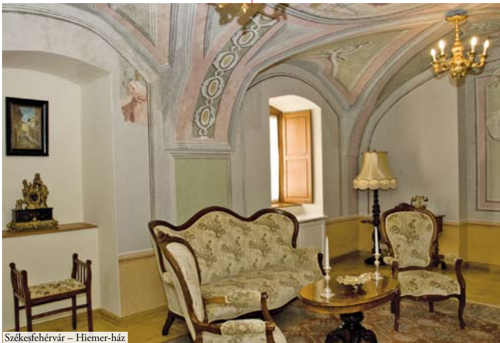
Székesfehérvár – Hiemer-ház

A török hódoltság után Székesfehérvárra visszatérő ferencesek templomukat és rendházukat a hagyomány szerint Szent Imre herceg születési helye fölé