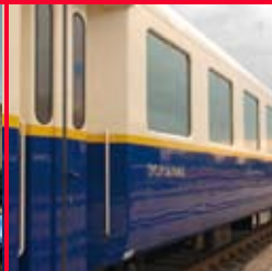
Budapest, MÁV Nostalgia Kft., Élményvonat