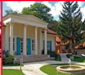
Budapest, Barabás villa