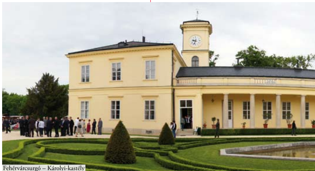
Fehérvárcsurgó – Károlyi-kastély

> 2000-ben az épület alagsorában került megnyitá- sra a Vértes élővilágát bemutató kiállítás. A kiállító- terembe lépve és körbetekintve a Vértes hegység és környékének változatos képe rajzolódik ki előttünk, melyet nem véletlenül neveznek „egy cseppnyi Ma- gyarország”-nak. A természeti és kultúrtörténeti értékek megismerését háromdimenziós életképek, gyűjtemények, fotók, grafikák segítik.