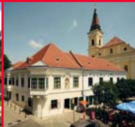
Székesfehérvár, Hiemer-Font-Caraffa épületegyüttes