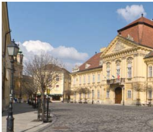
Székesfehérvár – Püspöki Palota

> 17-én 9h-tól egész nap: Szüreti mulatság és hagyományörző nap az önkormányzat szervezésében.