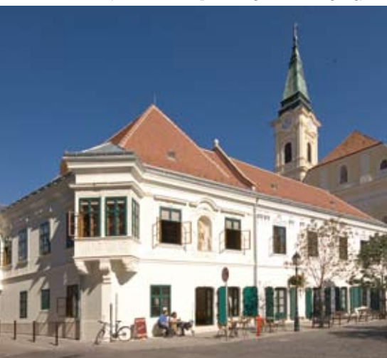
Székesfehérvár – Hiemer-ház

> 17-én 10h: Szüreti felvonulás és bál. A hagyományos szüreti felvonulás során népviseletbe öltözött fiatalok a falu utcáin felvonulnak és több helyen táncolnak. Este szüreti bál várja a szórakozni vágyókat.