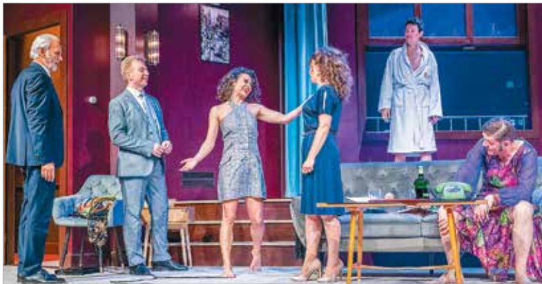
A szeretet „netovábbja”: mindenki ott köt ki, ahová tartozott...