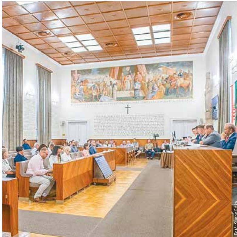
A rendkívüli közgyűlésen zárt ülésen döntöttek a Fehérvár FC Kft. értékesítésére kiírt pályázatról. Erről lapunk 15. oldalán olvashatnak részletesen!