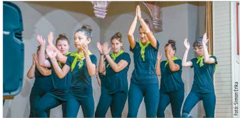
A zárókonferenciát a móri Gárdonyi Géza iskola tanulóinak műsora vezette fel