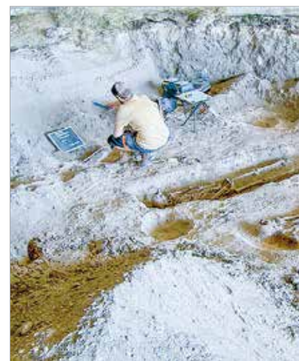
A sírokban nyugvó halottak tájolása is egyértelmű

pusztára, ezért adta magát a kérdés, mennyi esélyt látnak arra, hogy templomra találjanak: „Szakmai szempontból számomra Fornapuszta mindig is nagy kihívás volt. Vannak olyan makacs templomok, amelyek nem akarják megadni magukat. Meglepően sok forrásunk van a középkorból az itteni templom létezéséről, ugyanakkor zavarba ejtő az a forráshiány, amit a tájban