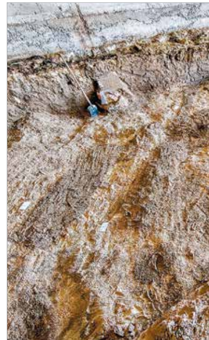
Amikor a markoló végzett, így rajzolódtak ki a sírok

Azt feltételeztük, hogy egy ilyen komoly stáb csak úgy habókra nem jön el kutatógatni Fornap-