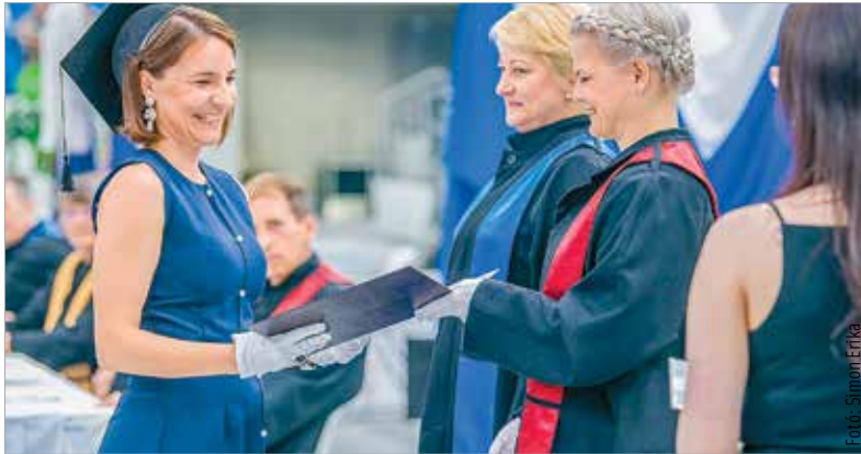
A szalagfektetés után a végzősök közül a helyszínen ötszázán vehették át diplomájukat

hátter nélkül. Az önkormányzat továbbra is segíti az intézményt: „Meghatározó a város jelene és legáltalább annyira a jövője szempontjából is a felsőoktatás kérdése. A Kodolányi János Egyetem régóta partnere már ebben Székesfehérvárnak. Örülök annak, hogy egy olyan partnere, amelyik az ország egyéb helyén vagy éppen Budapesten működött campus mellett nagyon fontosnak tartja a fehérvári fejlődést, a hallgatói létszám növelését és bővítését, és azon szakok bővítését is, amelyeket a fiatalok el tudnak érni. Ez fontos azért is, hogy