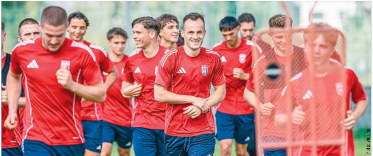
A csapat Sóstón készül, a jövő pedig remélhetőleg a pályán és azon kívül is mosolygós lesz!

„Az első helyezett az Amerikai Egyesült Államokban bejegyzett Final Third nevű cég, ami mögött portugál érdekltség