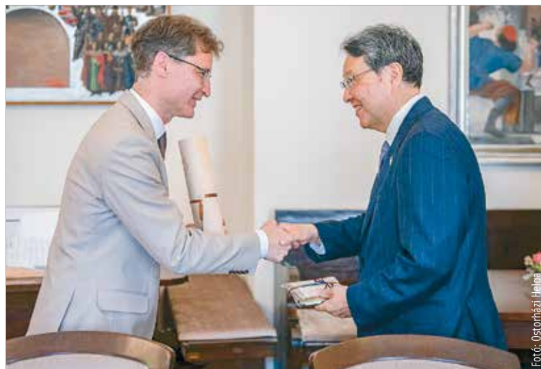
Kimura Tetsuya első alkalommal látogatott el Székesfehérvárra