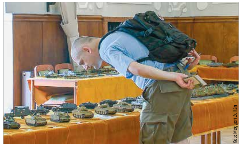
A harci eszközök makettjei idén is nagy érdeklődésre tartottak számot

kicsinyített mását tekinthették meg az érdeklődők. Pontosan rekonstruált történelmi járművek és háromdimenziós modellezés is szerepelt a kiállítás programjában. Egészen egyedi darabokkal is találkozhattak az érdeklődők, hiszen ez a fajta hobbi nemcsak egy adott jármű, épület vagy tárgy felépítéséről szól, hanem sokszor komoly kutatómunkát igényel, amelybe ma már bevonják a fiatalokat is. Az érdeklődők elmélyülhettek a látványmakettezésben, illetve lehetőségük nyílt 3D-nyomatásra, a börzén pedig válogathattak a számukra tetsző makettek közül.