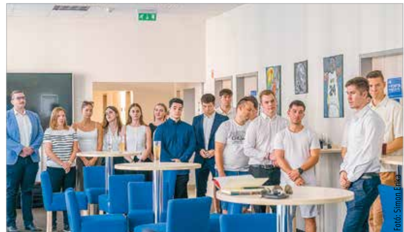
A most végzett sportközgazdászok egy része már az egyetemi évek alatt el tudott helyezkedni