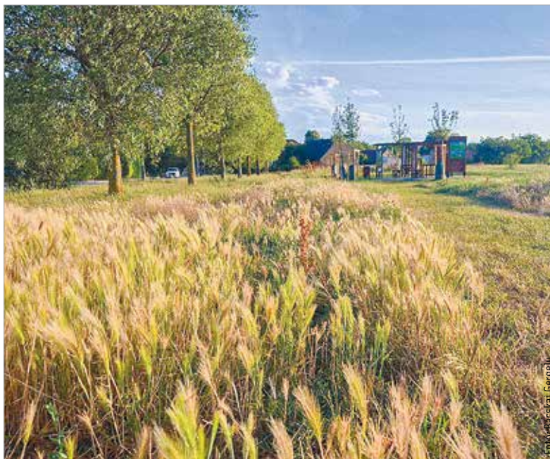
Az idei tavasz minden korábbinál szárazabb volt, ami jelentősen megnehezítette a városi zöldfelületek fenntartását

Szavazni a város honlapján lehetett június tizenötödiktől huszonnyolcadikáig, és öt lehetséges gyepgazdálkodási forma közül lehetett választani. Az önkormányzat és a Városgondnokság a szavazás eredményét fogja elsődlegesen figyelembe venni a jövőbeli fehérvári gyepgazdálkodás során. A Városgondnokság egyébként a lakossági visszajelzéseket figyelembe véve a jelentős mennyiségű toklász miatt – a lehető legmagasabbra állított késekkel – egyszer már végignyírta a zöldfelületeket. A kiemelt parkok kivételével április vége óta csak kontúrt húznak a fűnyírók a járdák mellett, tekintettel az aszályos időjárásra. Az elmúlt években folyamatosan egyre nagyobb hangsúllyal vették figyelembe a klímavédelmi szempontokat a gyepgazdálkodás során. A tavalyi évben is már több területet szándékosan