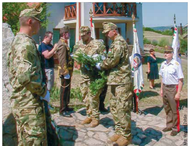
Pákozdon is megemlékeztek Szent Lászlóról