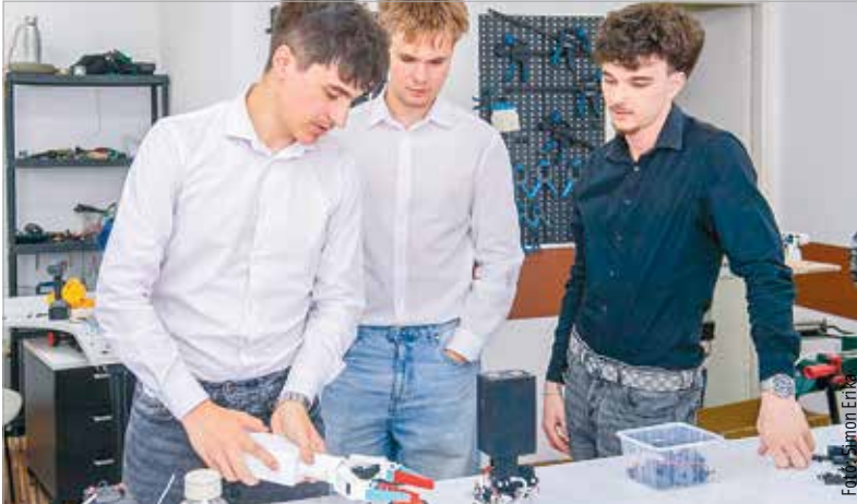
A diákok egy különleges műhelybe járnak. Az iskola egyik duális partnere az Enterpartner Kft., ahol az elméleti tudással felvértezett diákok a gyakorlatban maguk valósíthatják meg ötleteiket.