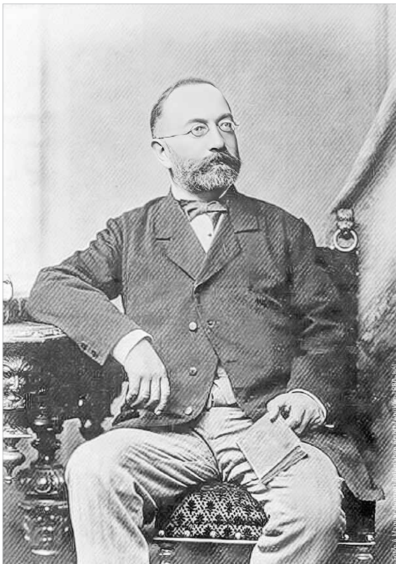
Budenz József 1886 után, függetlenül a finnugor elmélet megszületésétől még nyelvészeti tanulmányutakra ment a lappok, votjákok, csuvasok, vogulok, osztjákok és kis-ázsiai törökök vidékeire

Már Marburgban is úgy vélték sokan, hogy Budenz Benfey szellemi gyermeke, aki egész életére mestere intellektuális hasonmása lett. Benfey Tódor életrajzírója így írt a tanárról, Benfeyről, amit az 1896-os Budapesti Szemle nyolcvan-hetedik kötetében olvashatunk: „...ő lényének egész energiáját