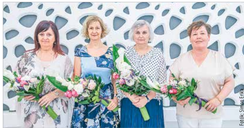
A Székesfehérvár Oktatásáért és a Székesfehérvár Ifjúságáért díjak idei kitüntetettjei