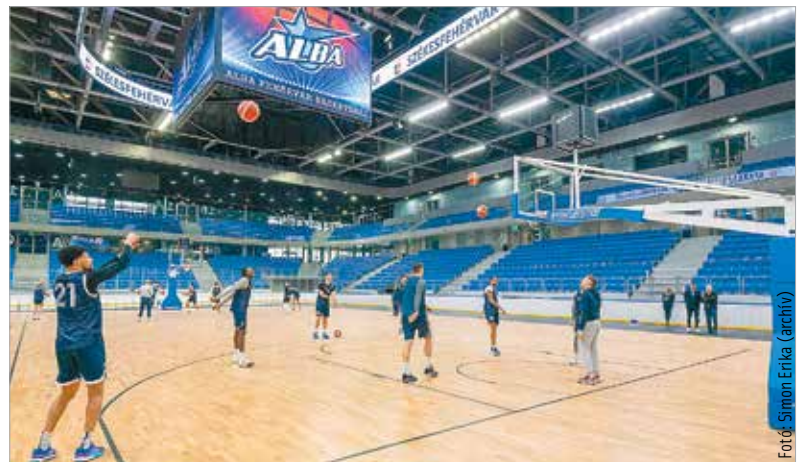
A kosárlabda eddig ritkán látott vendég volt a MET Arénában