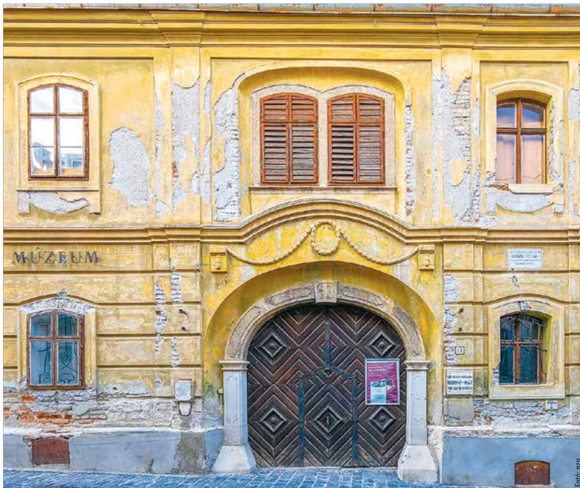
Az Arany János utca 12. szám alatt, ebben az épületben élt Budenz József 1858 és 1860 között