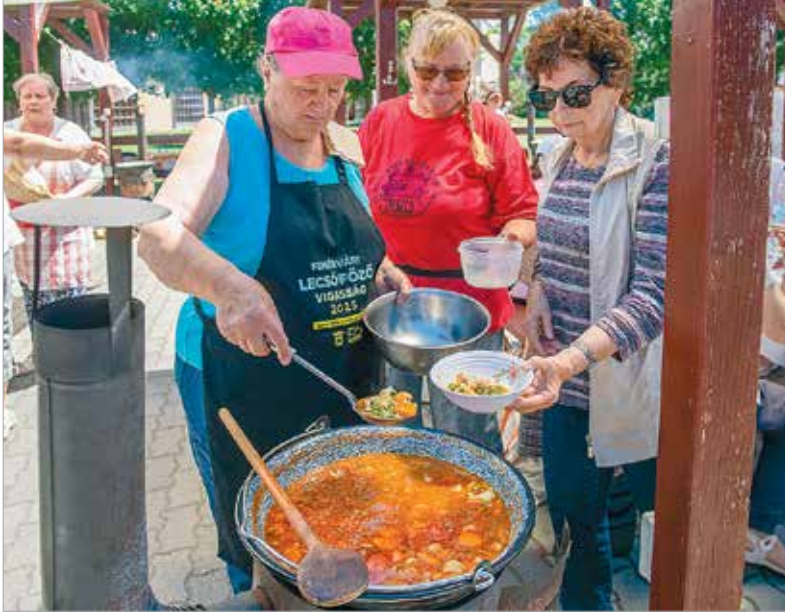
Kiviteles finomságok rotyogtak a bográcsokban

A találkozóra igen kreatív ötletekkel érkeztek a csapatok. A konyha hétköznapi mesterei ezúttal is elszakadtak a mindennapi borsófőzeléktől és -levestől: különleges, egyedi receptek alapján készültek az étek. A bográ-