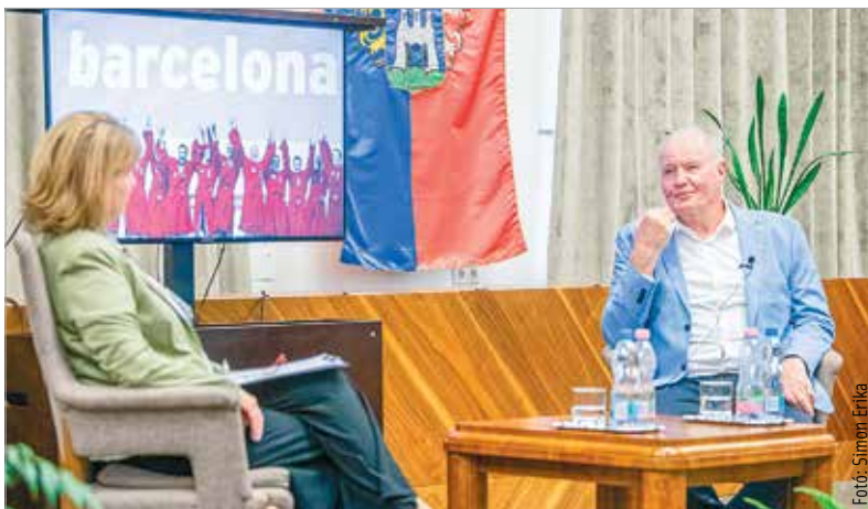
Kemény Dénes felidézte a nagy sikerekhez vezető fontos döntéseket is

előadásában Kemény Dénes. A férfi vízilabda-válogatott egykori szövetségi kapitánya hozzátette: a mentális felkészültség és a stratégiai gondolkodás adhat egy olyan különbséget a jó csapatok között, mely növeli a nyerési esélyeket. Az egész napos konferenciát Cser-Palkovics András nyitotta meg, aki kiemelte, hogy Székesfehérváron a mindennapokban is összekapcsolódik a jog és a sport. A konferencián szó esett a jogi mérlegelésről mint stratégiai döntésről, valamint a vádlottak tárgyalótermi viselkedése kapcsán az ügyvédi taktika és a manipuláció közötti különbségről is.