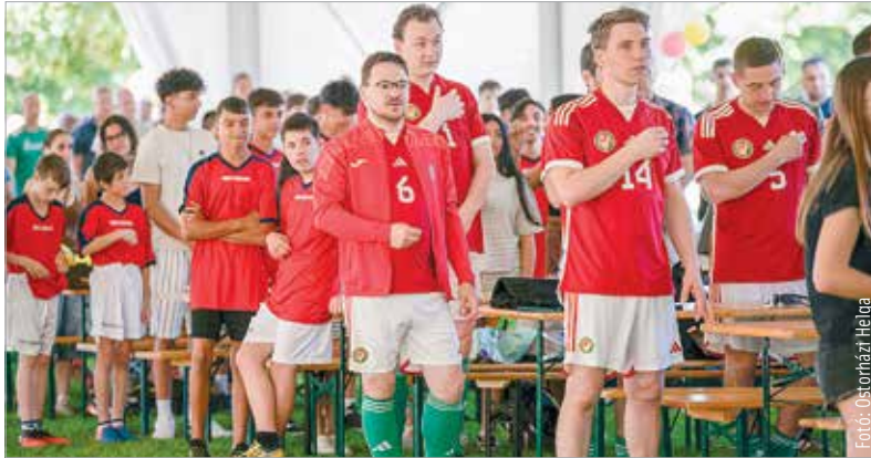
„Az immár hagyományos rendezvény célja, hogy közösségi élményeket és kikapcsolódási lehetőséget nyújtson a nevelőotthonokban és nevelőszülőknél élő gyermekek számára

Gyermekvédelmi Központ, a Szent Péter és Pál Görögkatolikus Gyermekvédelmi Központ, a Szent Miklós Görögkatolikus Gyermekvédelmi Intézmény, a Szent Zotikosz Gyermekvédelmi Intézmény és a Szent István Görögkatolikus Gyermekvédelmi Központ képviseltette magát, a fiatalokat pedig ügyességi feladatok, bemutatók, koncert és focimérkőzések várták. A rendezvény különlegessége volt, hogy a gyermeknap mellett a Szent István Görögkatolikus Gyermekvédelmi Központ fennállásának ötödik évfordulóját is megünnepelelték.