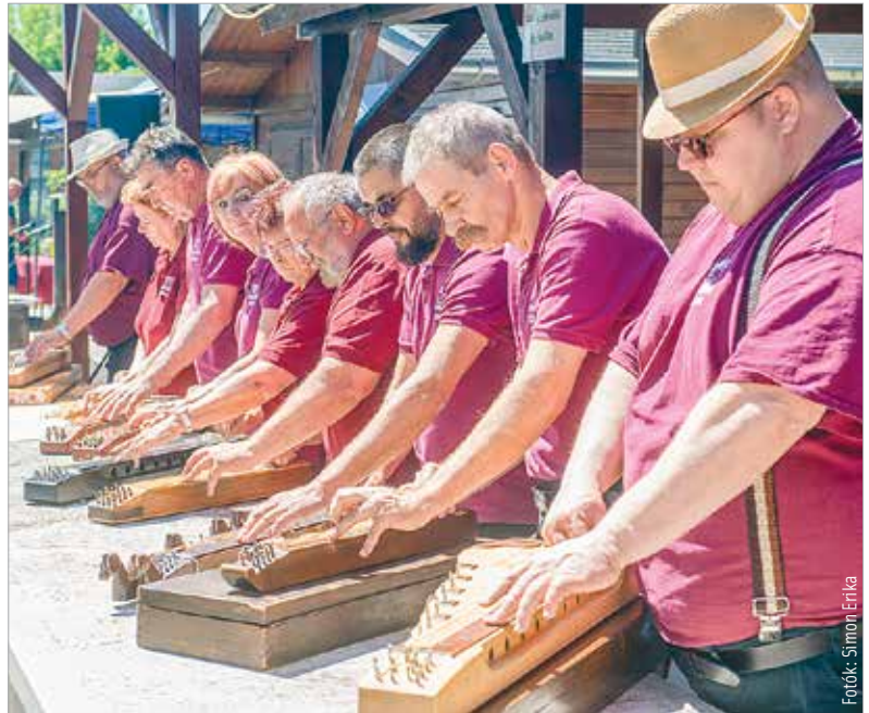
Idén is citerazenekar gondoskodott a jó hangulatról

csokban mindenféle zöldborsós ételkülönlegesség rotyogott. Összesen tizenkét csapat versenyzett egymással a különdíjakért és az értékes nyereményekért.