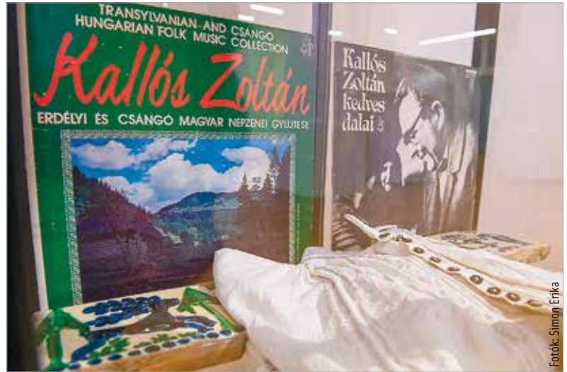
A tárlaton a teljes életmű kiállításra került