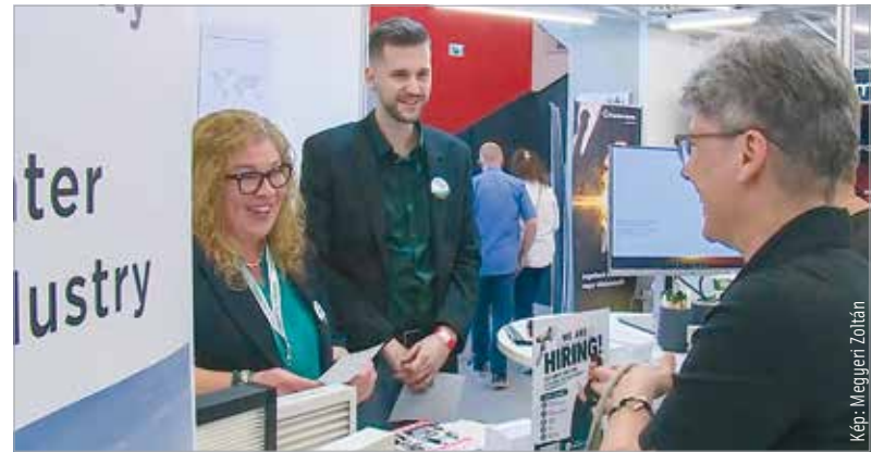
A személyes találkozás meggyőző erejű lehet