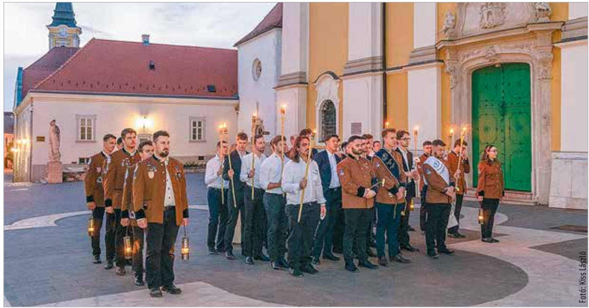
A hallgatók fáklyával, selmeci nótákat énekelve érkeztek a bazilika elé