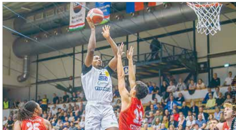
A Honvéd ellen az alapszakaszban és a rájátszásban is megnyerte eddigi meccseit az Alba

tagjai az élvonalnak, most pedig az ötödik hely sikernek számítana nekik. Az Albánál hagyományosan magasabban van a léc, de idén be kell érni azzal, hogy a Paks ellen simán elbukott negyedöntő után a Sopront felül tudta múlni a csapat, így játszhat az ötödik helyért. Hétfőn rossz kezdés után itthon 101:79-re nyert az Alba, vagyis ha szerda este, a lapzártánk után véget érő budapesti mérkőzést is megnyeri, akkor ötödik helyen fejezi be az idényt. Amennyiben szükség lesz harmadik meccsre a párharcban, azt pénteken rendezik Fehérváron.