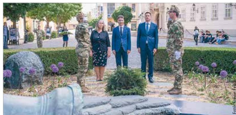
Csendes koszorúzásokkal emlékeztek pénteken a második világháború áldozataira Székesfehérváron. A világégés európai befejezése és az Európa-nap alkalmából hagyományosan a Béke téri orosz katonatemetőben, a Szentlélek katonatemetőben, valamint a Városház téri harangemlékműnél szervezett közös megemlékezést Székesfehérvár és Fejér vármegye önkormányzata.