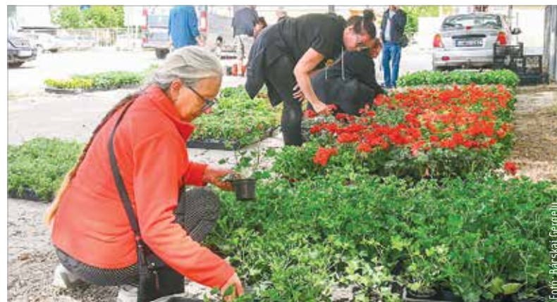
Több mint negyvennégyezer tő egygyári virágot és mintegy tizenháromezer tő muskátliit osztanak ki a napokban a Virágos Székesfehérvár programban résztvevő fehérváriaknak. A növényekre és a már kiadott komposztkeveretekre, esővízgyűjtőkre, fecskefészkekre, madár- és denevérodúkra tavaly ősszel lehetett pályázni. B. G.