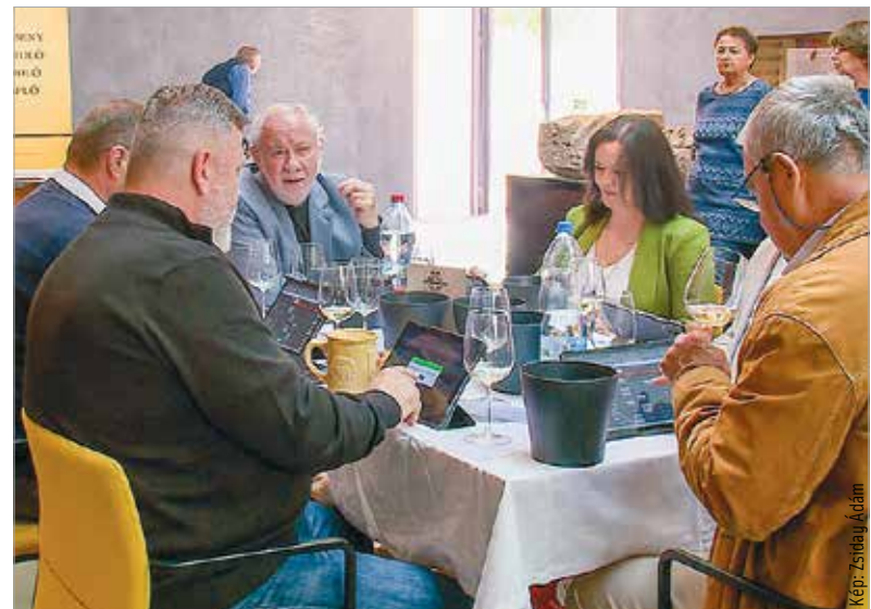
A zsűrizés során a nevezett hatvan tételből tizennyolc arany fokozatot ért el. A közeljövőben nyilvánosságot kap az is, hogy melyik borászat büszkélkedhet a Fejér Vármegye Bora rangos címmel.