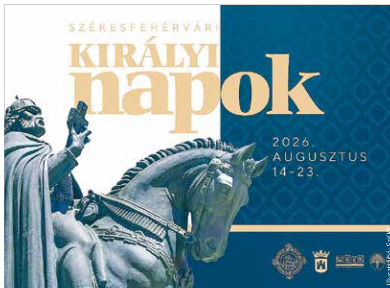
Augusztus tizennegyedikén kezdődik a Királyi Napok rendezvénysorozata