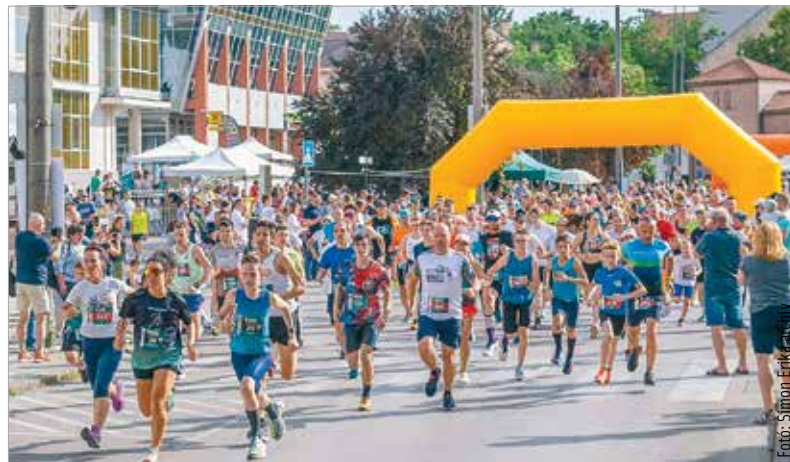
Idén is a Rákóczi úton rajtol a pünkösdhétfői futás

lönlegessége, hogy ezúttal online módon is gyűjthetik a pontokat az iskolák. A legtöbb internetes voksot gyűjtő iskola százezer forint támogatást kap. Idén is folytatódik a Szavazz, fuss az iskoláért! című verseny, hiszen a nap végén rendezett Depónia-futáson résztvevők egy PÉT-palack leadása után voksolhatnak kedvenc iskolájukra. Az első hat iskola összesen négyszázötvenezer forint értékű sportszerutalványt nyer. A TESZ-futáson először az egyéni és a váltóban futók rajtolnak el a 4, a 8 és a 11,2 kilométeres távokon. Nevezni az arakatletika.hu/tesz oldalon lehet!