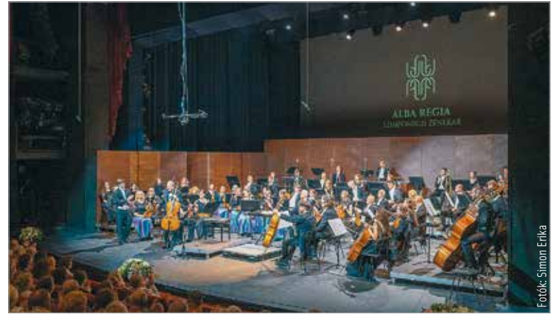
Az Alba Regia Szimfonikus Zenekar mindegyik koncertje nagy közönséget vonzott