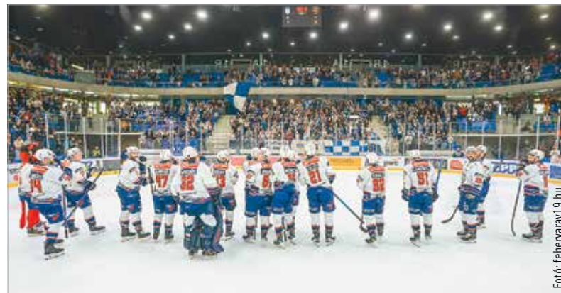
A cél, hogy a következő idényben is sokszor legyen telt ház a fehérvári jégcsarnokban