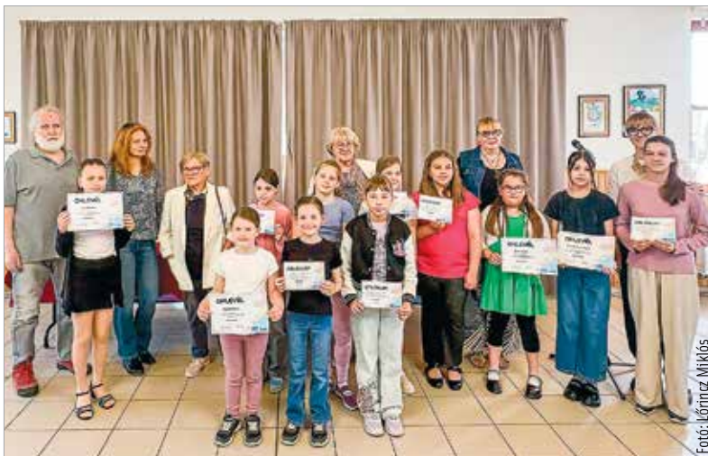
Tizenhárom település tizenkilenc iskolájának alsó és felső tagozatos tanulói küldtek be rajzokat