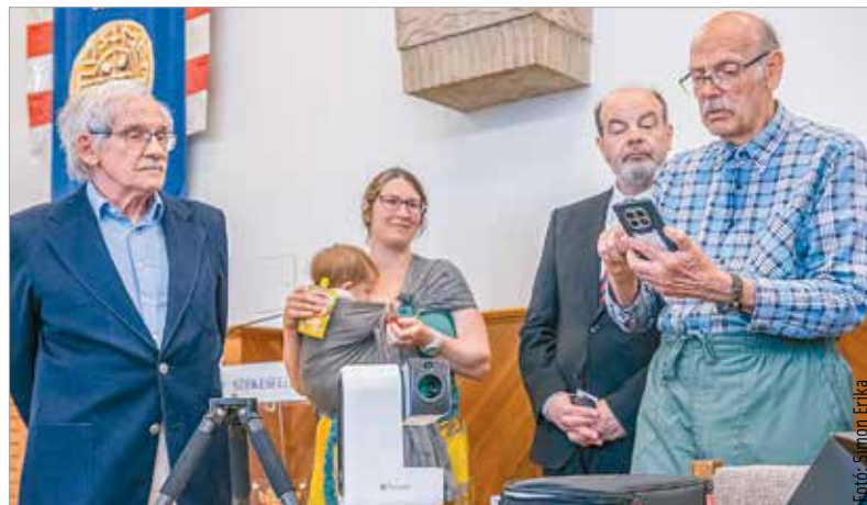
A tervek szerint már az idei csillagásztáborba is elviszik a teleszkópot, így a nyári éjszaka csodálatos égitestjeit is megörökíthetik majd a diákok