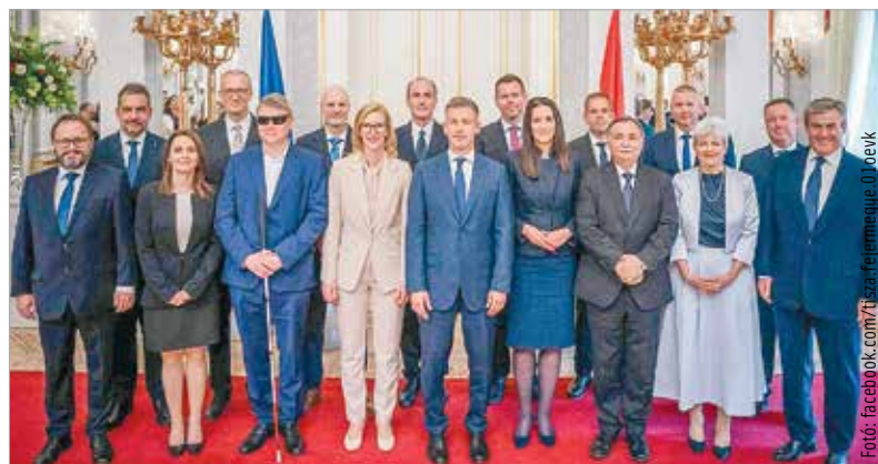
A kormány tagjai a Sándor-palotában, a miniszteri kinevezések átvételét követően

miniszterelnökséget vezető miniszter, Hegedűs Zsolt egészségügyi, Pósfai Gábor belügy-, Kapitány István gazdasági és energetikai, Kármán András pénzügy-, Görög Márta igazságügyi, Ruszin-Szendri Romolusz honvédelmi, Lannert Judit gyermek- és oktatásügyi, Kátai-Németh Vilmos szociális és családtügyi, Vitézy Dávid közlekedési és beruházási, Tarr Zoltán társadalmi kapcsolatokért felelős és kulturális, Bóna Szabolcs agrár- és élelmiszergazdasági, Lőrincz Viktória vidék- és településfejlesztési, Gajdos László élő környezetért felelős, Tanács Zoltán tudományos és technológiai miniszter.