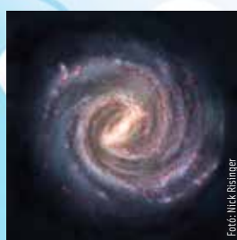
2026. május 14–20.