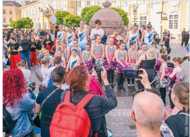
A táncosok idén is megmutatták, mekkora erő és szenvedély lakik a fehérvári próbatermek falai között, és hogy a test és a lélek harmóniája napjainkban még fontosabb, mint korábban bármikor

kortárs táncnak és művelőinek is. A résztvevőket Cser-Palkovics András polgármester köszöntötte, aki szerint fantasztikus ereje van annak a közösségnek, amelyet a fehérvári táncosok,