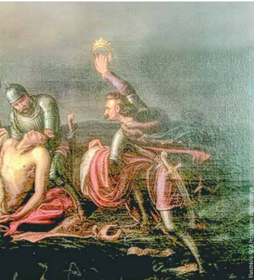
Illusztráció: Orhai Petricus Soma olajfestménye

nyomossá, hogy Magyarország uralkodó nélkül maradt