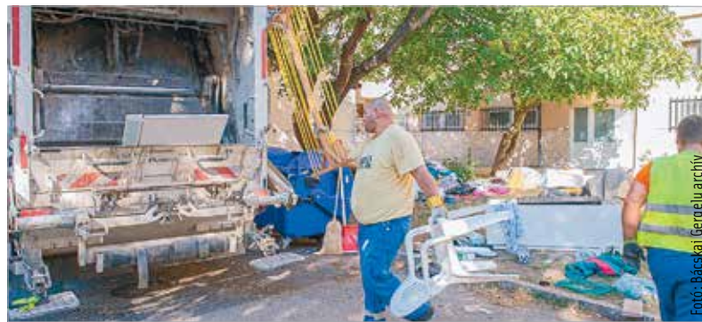
A lomtalanítás során meg lehet szabadulni a nagy méretű háztartási hulladéktól