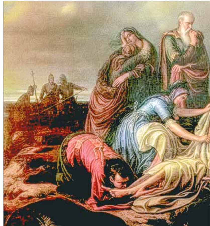
A drámai csatavesztés után csak később találták meg a fiatal király, II. Lajos holttestét, és vált biz-

területén III. Frigyes császár tartományainak megtámadására. 1483-ban ismét fegyverszünetet kötött. II. Bajezid török császárnak címzett levelében a következőt írta: „Hatalmas fejedelem, urunk és szeretett barátunk! Tökéletesen megértettük hatalmasságod fegyverszünetéről szóló, hozzánk intézett levelét. Amint hatalmaságodnak, úgy kegyességünknek is tetszésére vannak a feltételek. Lesz azonban néhány nyakas ember, aki nem akar majd rendeleteinknek engedelmessé válni. Végül ha Istennek is úgy tetszik és a kettőnk akaratának is megfelel, örökös béke is létrejöhét közöttünk.” A szerződést megújította ő, majd II. Ulászló is. II. Lajos uralmának 1516-tól kezdődő éve is ilyen folytatást ígértek. 1520. szeptember harmincadikán trónra került (Canoni) Szulejmán szultán. A Canoni előnevet a török utókortól kiváló törvényalkotási