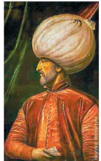
Illusztráció: Melchior Lorck

A mohácsi vereség logikus következménye volt a beállott belső romlásnak. A csatavesztés az erő, ügyesség és megfontolás nélküli vakmerőség fájdalmas kudarca volt. Az ország vezetői a gyenge magyar sereget minden számítás nélkül vetették be, a vak szerencsére bízva a diadalt vagy balsikert. Az ország Mohácsnál elbukott, elvesztette függetlenségét és önállóságát.