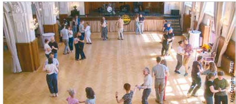
Több százan táncoltak a Come Around Swing Family által szervezett ötnapos Come Around Balboa Weekenden, amelynek központi helyszíne ezúttal is a Szent István Hitoktatási és Művelődési Ház volt. Nappal órákat tartottak, esténként pedig bulival ünnepeltek, amelyen bemutathatták az aznap tanultakat, sőt egymással is versenyezhetek a táncosok. P. L.