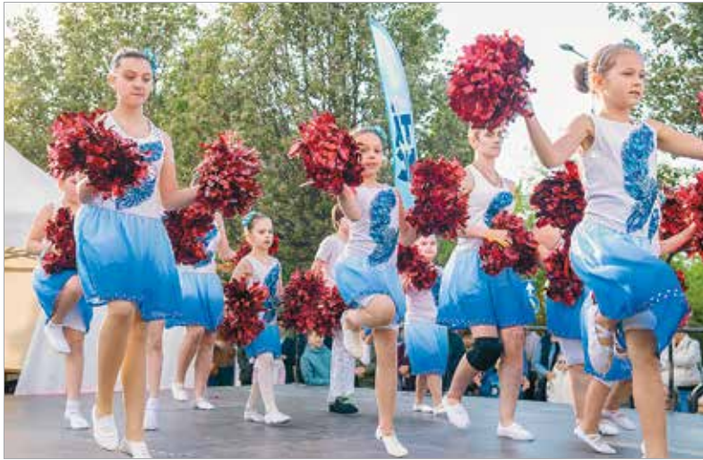
Minden korosztályban színvonalas produkciókat láthatott a közönség