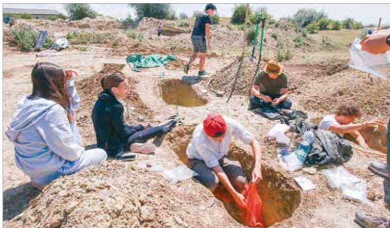
Nem véletlen, hogy az avar kori ásításokon sok fiatal egyetemista is dolgozik, hiszen ez az ismeretlen világ bármikor hozhat új eredményeket

Szabados György ehhez azt tette hozzá, hogy az írott kútfők köre nagyjából ismert. Új krónikák előkerülhetnek, de ritkán. A mítoszokat pedig – például a Csodaszarvas-mondát – nem „városi legendaként”, hanem identitás-alapozó kulturális kincs-ként érdemes kezelni. Ugyanakkor a