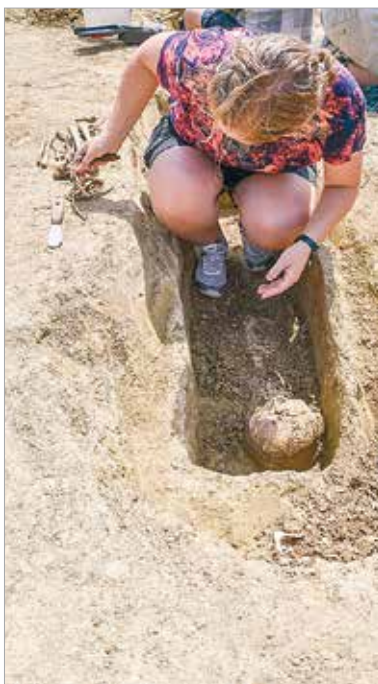
A sírok nemcsak az oda temetettekről árultak el információkat, de az avar korra jellemző temetési módszerekről is. A halottak mellé például élelmiszert is tettek, hogy a túlvilágon folytathassák életüket.

Emlékeztetett arra is, hogy már a 18. században volt olyan történetírói szemlélet, amely a hunok, az avarok és a magyarok történetét nem egyetlen, egyenes vonalú fejlődési láncként kezelte. Pray György jezsuita történetíró például a párhuzamos folyamatok gondolatával dolgozott, és amikor megérkeztek hozzá az északi nyelv-