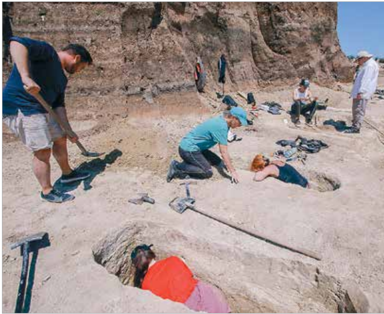
A csákszerényi avar kori sírokat két-három méter magas földréteg rejtette el a külvilágtól, amit a helyszínen indított beruházási munkálatok során hordtak rájuk

Szabados György szerint a viták egyik oka, hogy az őstörténeti témákhoz a közbeszéd gyakran erős érzelmi töltettel közelít.