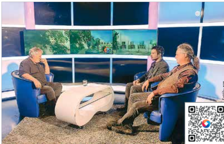
A stúdióbeszélgetésről felvettelt készítettünk, amit megnézhetnek a Fehérvár Média centrum Youtube-oldalán, ha a képen látható QR-kódot beolvasják!

Szabados György szerint a történésszek helyzete más, de nem feltétlenül könnyebb. Az írott források esetében a nagy „információrobbanás” már a 17–18. században lezajlott, azóta inkább „csurranak-cseppennek” az adatok. Új eredmények ezért gyakran a vitatott adatok újragondolásából születnek. Kiemelte Szádeczky-Kardoss Samu és Olajos Terézia munkásságát: az avar kor írott kútfőiből alaposan jegyzetelt, kommentált gyűjtemény született a 6. századtól a 9. századig, sőt az összeomlás utáni időkhöz. A régé-