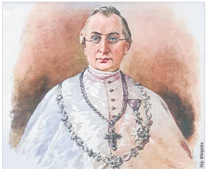
Rónay Jácint a Nemzeti Színház drámaíróbizottságának is tagja volt az emigrációból való hazatérését követően

Folyamatos menekülés és bujkálás lett az élete. Emigrált Londonba, csak 1866-ban tért haza, s lett az MTA jegyzője. 1889. április tizenhetedikén Pozsonyban halt meg.