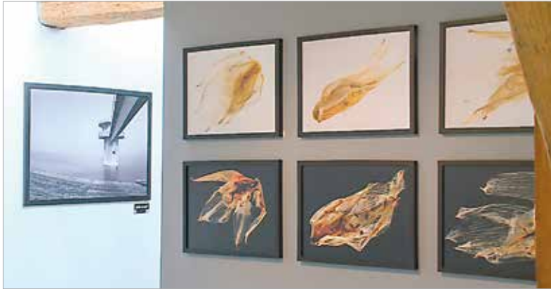
A kiállítás egy hónapon keresztül látogatható a Gárdonyi Géza-émlékház mellett található Velencei-tavi Galériában