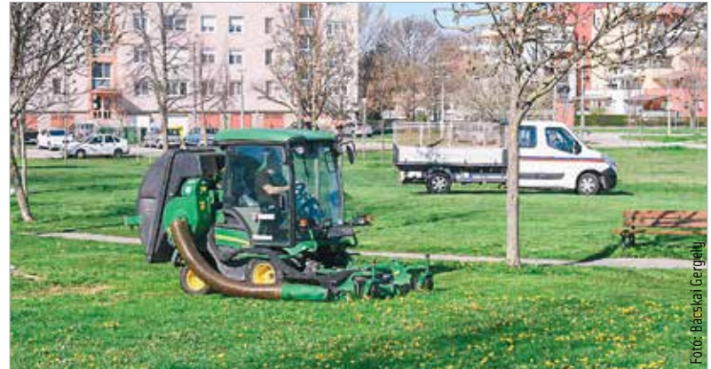
A nyírást tizennyolc nagy teljesítményű fűnyíró traktorral és mintegy ötven fűkaszával végzik a parkfenntartók

Egyre többen vannak azonban, akik több olyan területet szeretnének a városban, ahol nem nyírják rendszeresen a fűvet. Több mint