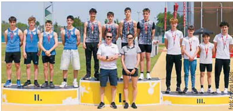
Kitettek magukért az ARAK fiataljai: tizenhárom arany-, ugyanennyi ezüst- és tizennyolc bronzéremmel zárták a szezon első szabadtéri versenyét. A közel nyolcvanfős fehérvári csapat számos egyéni csúcsot és értékes helyezést is elért a múlt hétvégi győri versenyen. S. Z.