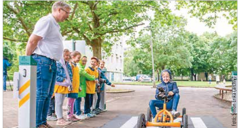
A közlekedési kultúra napja jövő hétfőn lesz, a rendezvényre mintegy kétszázötven gyermeket várnak