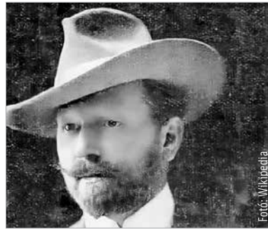
Tull Ödön festőművész (1870–1911)

valami szép, ami megfogható, ami nézhető, ami gyönyörködtet. A családja polgári volt ugyan, de nem a vagyonuk tartotta életben, ezért egy asztalosműhelybe szegődött inas-ként, ahol nemcsak pénzt keresett, de alkotóvágyát is kiélhette. Mint oly sok fiatal az ő korában, Tull Ödön is vágott a fővárosba. Ott első alkalommal a litográfia, azaz a könyvmás segítségével kamatoztatta rajzkészségét egy lapkiadónál. A nyomtatás egyébként is új és népszerű volt abban az időben, főleg, ha az olvasókat szép és értékes rajzokkal lepték meg. Ráadásul egy ösztöndíj segítségével tovább is