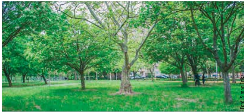
A tóvárosi sétány mellett idén is lesz méhlegelő

két és fél hektáron alakított ki idén méhlegelőt a Városgondnokság a beporzó rovarok érdekében, amelyet csak a nyár második felében fognak lekaszálni. Ezeket a területeket információs táblák is jelezzik.