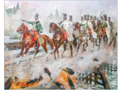
A fehérvári festő egyik legismertebb alkotása a Simonyi öbester az égő arcolei hídon című festménye, amin csapatait vezeti az európai hírű huszárvézér

Ha egyszer egy üzlet beindul, nincs megállás: Tull Ödönt várta Párizs és a művészet! A Julian Akadémián érezte először, hogy alkotásából jó lenne küldeni haza, hogy otthon is lássák, meddig jutott. 1892-ben első képeit ki is állították a Múcsarnokban. Gyorsan népszerű lett idehaza. Többen várták, hogy visszajöjjön, és megrendeléseket adhassanak az új művésznek. Be is tört a hazai alkotók világába, amikor a millenniumi ünnepségek keretében elkészítette Herkulesfürdőt ábrázoló falfestményét az egyik pavilonban. Sokan sokat rendeltek a festőtől, de talán a