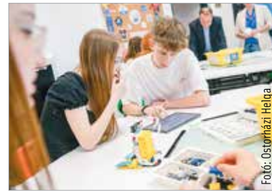
Fotó: Östörházi Helga

„Itt most a digitalizációt és a művésze-