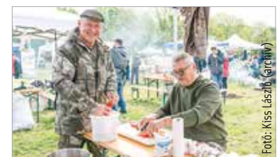
Idén is megtudhatjuk, milyen sokféle, ízes étel készíthető halból

A tekézés átmenetileg szünetel május 22-e és június 7-e között, mivel edzéslehetőséget biztosít a pálya a Székesfehérváron rendezendő Teke Világbajnokság versenyzői számára. A tekézést a Nyitott tornatermek keretében május 9-én és 16-án, illetve június 13-án és 20-án 17 és 20 óra között biztosítják egyéb pályán, az egész tekecsarnokban. Folytatódnak a nordic walking foglalkozások is: az ingyenes program immár minden városrészben elérhető. Részletek a fehervar.hu oldalon!