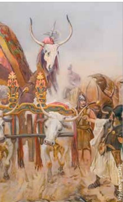
Árpád nagyfejedelem felesége, a nagyasszony

Szabados György történész részletesen elemezte a nyelvi átalakulásokat is egészen a tizenegyedik század közepéig, amikor megszületik a tihanyi alapítólevél. De beszélt még arról is, miként kellene a „kettős honfoglalás” elméletét újraalkotni, át gondolni. Mindezeket az fmc.hu oldalra feltöltött videóban meghallgathatják!