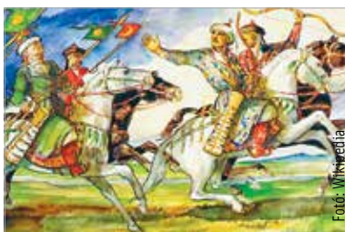
A megmaradt háromezer hun Csigla-mezei telepedett meg, és várta Csaba királyfi visszajövetelét

ban megtámogatta, hogy az előbbi krónikának van alapja. Szerinte a székely olyan belső-ázsiai népközösség lehetett, amelyiket a Hun Birodalom besodort a Kárpát-medencébe, nyilván hun fennhatóság alatt, itt átélte az évszázadokat, majd csatlakozott a magyarokhoz. E nép kis csoporttudata bekerült a középkori magyar keresztény krónikákba. Abban az időben nem volt szokás a politikai váltáskor a népirtás. Például a hunok germán