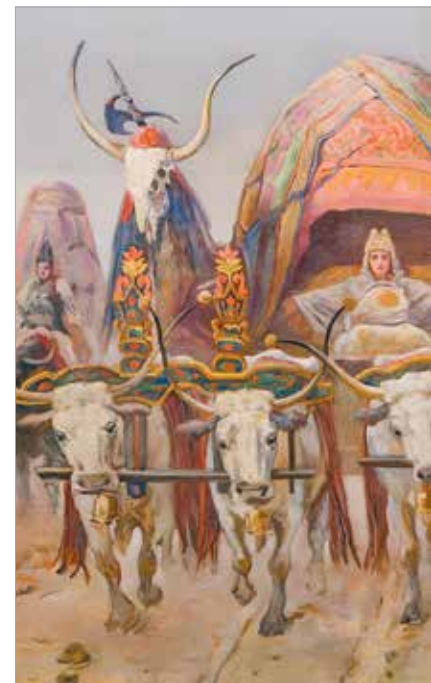
A Feszty-körkép talán legcsodálatosabb jelenete: vonulása négyökrös diadalszekéren

A Fekete-tengeri, Azovi-tengeri térségben, ahol egyébként a Csodaszarvas mondája játszódik, ahol ez a görögösen Muagerisz, vagyis Magyar nevű kutrigur hun uralkodó élt, mintegy háromszáz évvel később megszületett egy Álmos nevű „fejedelmi személy”, aki Dentümogyerben, más néven Etelközben megalapította a magyar sztyeppeállamot. Ezen összefüggések bonyolultsága miatt nincs értelme őstörténeti „krumplikat”, vagyis körülhatárolt őshazákat rajzolni a térképekre, hogy ez a kis krumpli Levédia, ez a másik krumpli Etelköz, és a két krumpli között ott a légüres tér, mert ez nem így van! Az avar-hun vegyes népesség gyarapodott a kutrigur, utigur, szibar és a tarniach var és huni népek közül való társasággal – bár a kutrigurokat és szabirokat máshol simán hunnak nevezik. Aztán 670 tájékán jön egy másik birodalomgyarapító népesség, az onogur bolgár bevándorlás. Utóbbiak is hunféle népesség, csak a bolgár egy új csoportjelölő. Vezető-