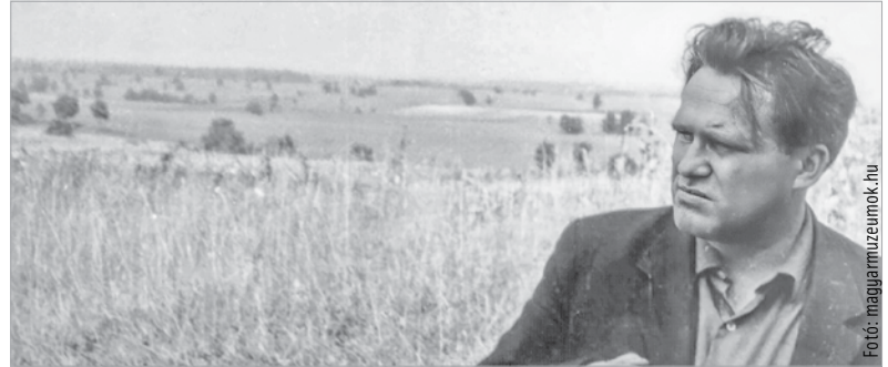
Pesovár Arany János gondolatát vallotta: „Egy élet e tánc, melyben lélek a dal”

Április huszonharmadikán lesz Pesovár Ferenc néprajzkutató születésének kilencvenötödik évfordulója.