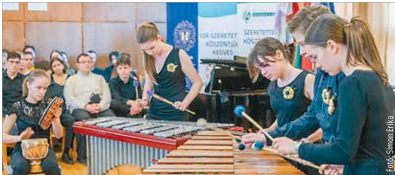
Három napon át zengett a muzika a Hermann László Zeneiskolában. A XVI. Országos Alba Regia Kamarazenei Versenynek idén is Székesfehérvár adott otthont a hétfvégén. Az ország negyvenöt zeneiskolájából hetvenöt kamaracsoport, duók, triók, kvartettek és kvintettek léptek színpadra.