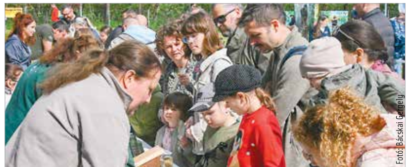
Vidám nyílt nappal ünnepelte harmadik születésnapját a Sóstó Vadvédelmi Központ vasárnap. Ismeretterjesztő előadások, idegenvezetés, madárgyűjűzés – számos érdekes program várta a látogatókat, akik megismerhették a létesítmény mindennapjait, illetve az itt lábadozó madarakat és emlősöket. Az elmúlt években közel ötezer állatnak nyújtottak segítséget.