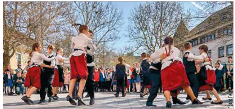
Táncbemutatót tartottak pénteken a Felsővárosi Általános Iskola német népviseletbe öltözött diákjai a belvárosban. A gyerekek a magyarországi német népviselet napjához kapcsolódóan tartották a programot.