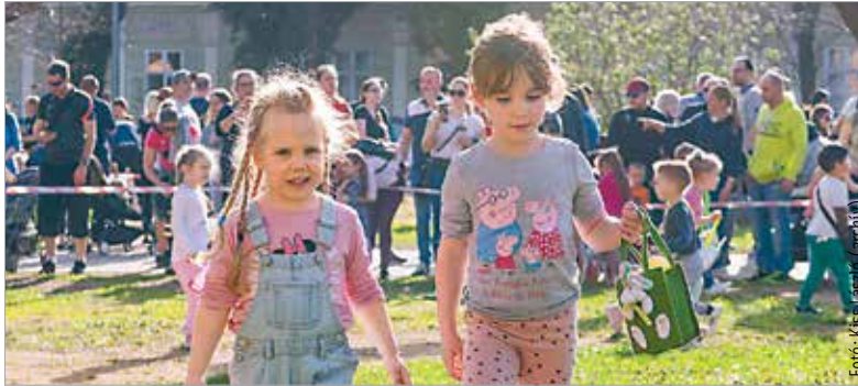
A tojásvadászat öt különböző korosztályban zajlik majd: tízezer műanyag tojásban elrejtett cukorkát kereshetnek meg a gyerekek a parkban. A rendezvény ingyenes, de regisztrációhoz kötött.

Az ünnepi hétvégén az Öreghegyi Községi Házban húsvéti forgatagot rendeznek. Április 19-én, szombaton 15 és 19 óra között húsvéti díszeket készíthetnek dekupázstechnikával, a közösségi ház udvarán, a Virgonckodó játszóparkban pedig nyuszis, bárányos és tojásos tavaszi fajtékocokat próbálhatnak ki a gyerekek. A színházteremben három órákor A legcsinosabb óriás című mesét lát-