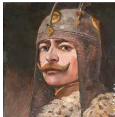
Akire oly sokat hivatkoztunk beszélgetéseink során: Biborbanszületett Konstantin bizánci császár

Regino prümi apát, aki a kilencedik és a tizedik század fordulóján élt, miért mondja azt, hogy a honfoglaló magyarok előbb a pannonok és az avarok lakott síkvidékein kóboroltak? Regino ismeri az avar nevet, és azt is tudja, hogy a magyarok Szkítiából jöttek. Valamilyen szinten ő is antikizál, de ő az avar csoportjelölőt használja. Hadd utaljak megint egy fontos korabeli forrásra, a tizedik század elején lezárt Fuldai Évkönyvek szövegkorpuzára! Ők egyenesen a magyaroknak nevezett avarokról