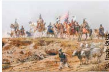
Feszty Árpád műve Ópusztaszeren: a magyar honfoglalók bevonulása a Kárpát-medencébe, ahol Árpád nagyfejedelem vezeti a vegyes etnikumú népességet

kel együtt, hogy „ha nem volt leírva, akkor nincsenek bizonyítékaink”. De ez akkor nevezhető bizonyítéknak? Nevezhetném bizonyítéknak is, de óvatosabban kell fogalmaznom. Ez a több torzuláson átment hagyományadat ezt támogatja. Az összkép azonban bonyolult. Ahogy a száztízötödik éve született László Gyula régész megfogalmazta a kettős honfoglalás elméletét, azóta rengeteg lelet került elő, a régészet módszertana is finomodott. Tehát régészetileg ez a kép természetesen már nem érvényes, de