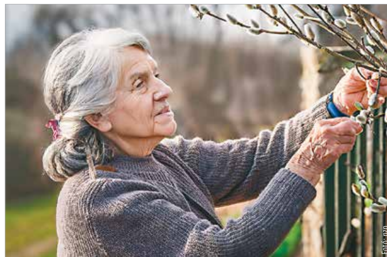
Az idősek pontosan tudják, hogy a kapuhoz kötött barka elúzi a háztól a villámást, a mennydörgést, de még a hivatlan háztűzet is!

úgy is gondolták, hogy a zsidók megszabadítója érkezett el. Azonban Krisztus nemcsak a zsidókat szabadította fel, és nem a római uralom alól, hanem az emberiséget a bűn rabságából. Miért választotta a tömeg pálmát? Mert az a katonai győzelmeke szimbóluma volt abban az időben. A vezérek a háborúkban lóháton érkeztek a győzelem helyszínére. Jézus viszont a békeidők jelképével,