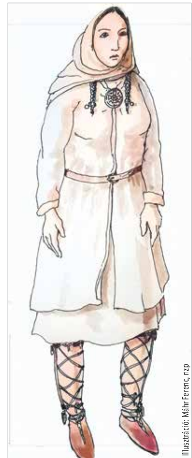
Illusztráció: Máhr Ferenc, n.zp

Az egyik csákszerű- orondpusztai sírban eltemetett nő germán eredetű viseletének lehetséges rekonstrukciója