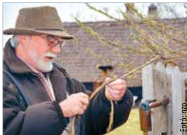
Megkezdődnek a nagyhéten a kertben és a hétfői házaknál folyó munkák is – talán ezt már az időjárás is tudni fogja...

Ez a hét nap egyben a nagyböjt utolsó időszaka, amit a böjt szempontjából a legszigorúbban vesznek. Már évszázadokkal ezelőtt is természetes volt, hogy ekkor nemcsak a húst vonja meg magától az ember, hanem mindazt, ami kötődést, hétköznapi örömet jelent – ezzel mondunk le önmagunkról. De a nagyhét a könyörület, az alamizsna hete is, amikor meglátjuk a hiányban élő embertársunkat. Erre a mindennapokban is szükség van, de a nagyhéten szinte kötelező. A legfontosabb viszont az, hogy