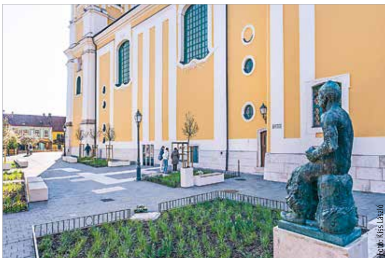
Érdemes tenni egy sétát a téren, hiszen ahogy fejlődnek a növények, napról napra szebb lesz!