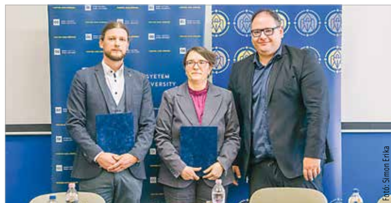
Ünnepélyes keretek között írták alá a megállapodást az egyetemen

Míndez mellett a jövőben fontos szerepet kap a szakmai hálózatépítés, közös szakmai-tudományos rendezvények megvalósítása, valamint a felek fórumot biztosítanak egymás számára tudományos és gyakorlati eredményeik publikálására.