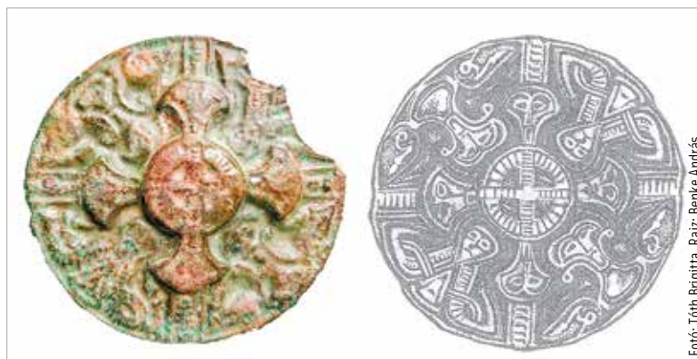
Az egyik Csákberényi-Orondpusztán eltemetett nő sírjából előkerült korongfibula fényképe és kiegészített rajza