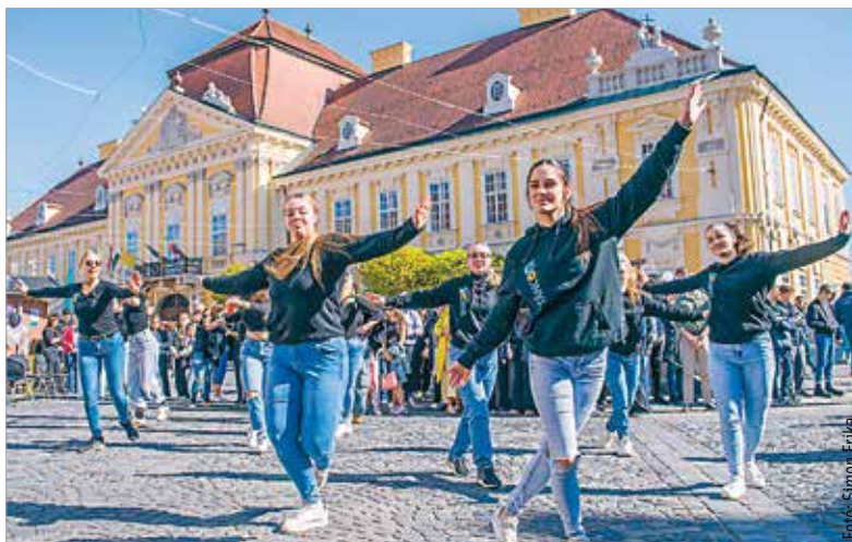
A Gorsium iskola diákjai táncos megmozdulással adták meg az idei Szakmák utcája fesztiválhangulatát

A Székesfehérvári Szakképzési Centrum összes intézménye, a partnercégek és a mezőgazdasági iskolák is kitelepültek a fesztiválra. Az interaktív kiállításon mindenki más-más szakember bőrébe bújhatott, kipróbálhatta, milyen például az állattenyésztők élete. A fesztivál megnyitóján a szakképzésért felelős helyettes államtitkár, Palmay Gergely hangsúlyozta, hogy olyan rendszert hoztak létre, mely a felzárkóztatástól a tehetséggondozásig mindenre lehetőséget kínál úgy, hogy közben a piac igényeit is kielégíti: „A szakképzésben a felzárkóztatástól a tehetséggondozásig mindenkinek karrierutat kínálunk.