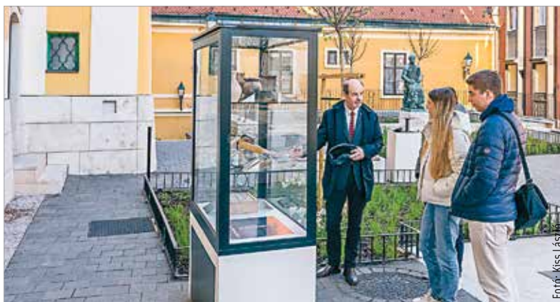
A bazilika felújítása és a régészeti feltárások után kezdődhetett el a tér felújítása, ahol egy szabadtéri vitrinben az ásatáson előkerült leleteket is meg lehet nézni