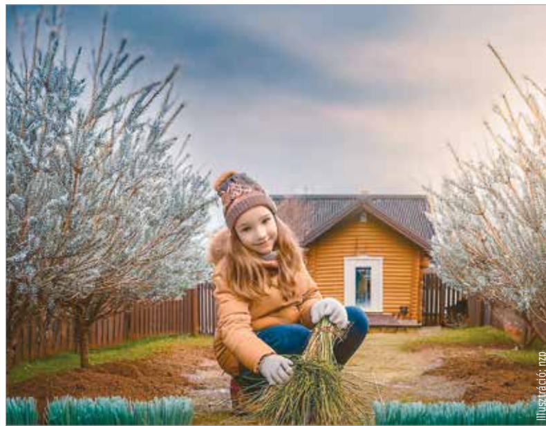
A fiatalság a nagyhét kezdetén virágot gyűjt, hogy a templomba vezető úton szétszórja azokat, várva a Megváltó jöttét

és elhossa az ő szabadságukat. Ezért Dávid fiaként üdvözölték Krisztust, aki szamarháton érkezett a városba. Az ünneplők egy része levetett ruhákat, másik része letört zöld pálmaleveleket szórt elé, és „Hozsanna! Áldott, aki az Úr nevében jön!” felkiáltással fogadta a Megváltót. És a jeruzsálemiek