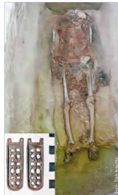
Fémveretes díszövel eltemetett késő avar kori férfi sírja a csákberényi arató-szerűi temetőből, illetve a liliomos díszű szíjvégének elő- és hátlapja

Baján kagán volt az, aki levezényelte az avar honfoglalást. Ő ilyen értelemben Árpád nagyfejedelem lelki rokona. Neki köszönhető, hogy 567-568-ban az Avar Kaganátus olyan nagy birodalom-má vált. Ez volt az aranykora az Avar Kaganátusnak. Baján kagán a hetedik század elején, 602-ben – ez az év sokak által vitatott – meghalt. Az biztos, hogy a 626-os konstantinápolyi fiaskónál már nem élt. Aki azt a csatát levezényelte, valószínűleg Baján fia lehetett. A kunbábonyi sír ma elfogadott keltezése a hetedik század második harmada, azaz a 630-as és a 660-as évek közé esett. Tehát valóban Baján kagán unokájáról lehetett szó, amennyi-