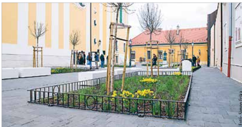
A megújult közösségi téren tizenegy nagyobb fát, húsz lombhullató cserjét, huszonnyolc törzsrózsát, nyolcszázötvenkét élő növényt, kétezer-hatszázötven virágágyást és díszfüveket is ültettek