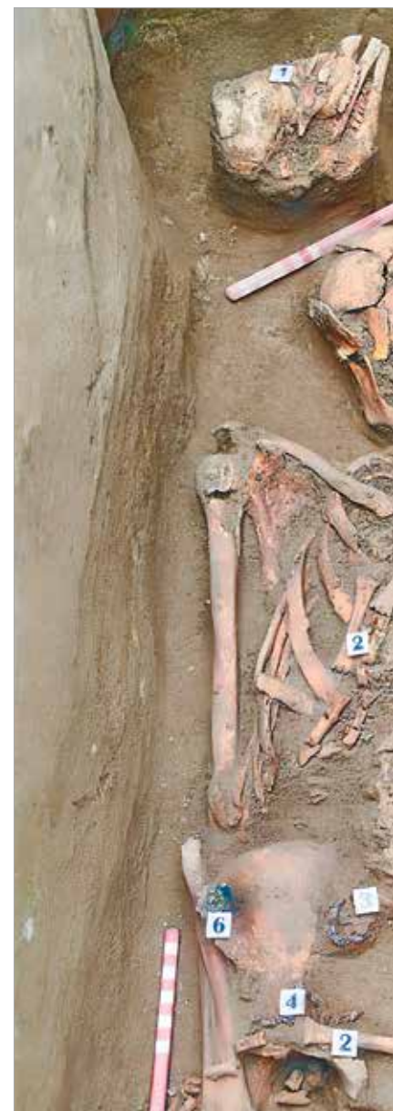
Juhbőrös temetkezés Csákbereyn-Arató-szerű temetkezési birkakoponyával