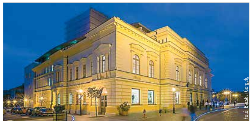
A közgyűlés várhatóan április tizenegyedikén, pénteken dönt az igazgató személyéről