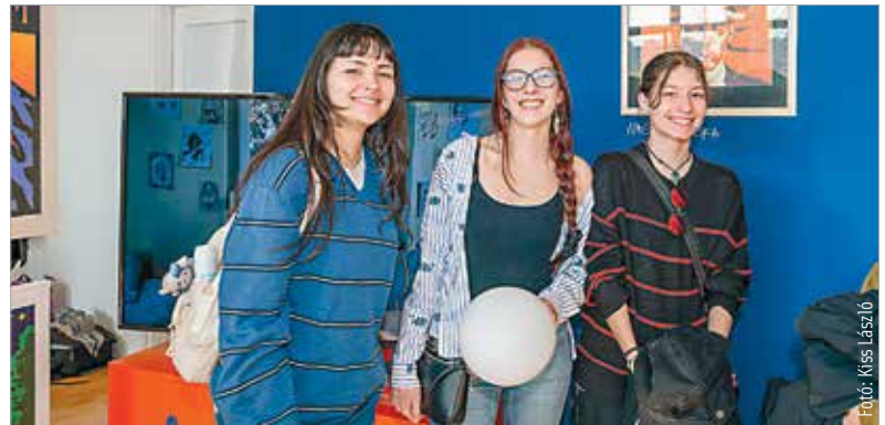
Az alkotásokat, előadásokat szakmai zsűri értékelt és minősítette