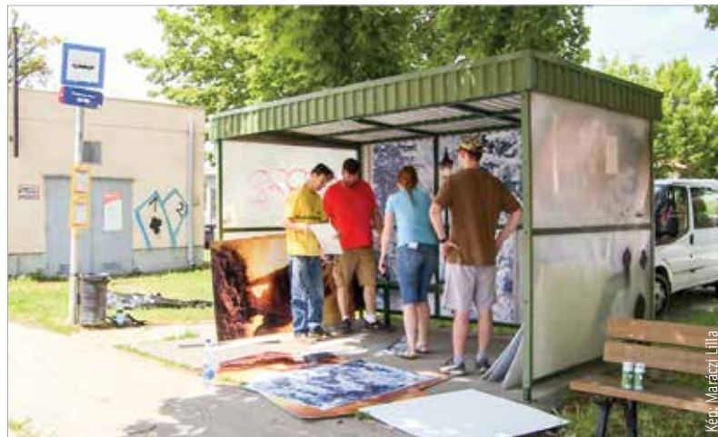
A Narnia krónikái ihlették a Magyar Kétfarkú Kutya Párt buszmegálló-felújítási akcióját

Az MKKP székesfehérvári listavezetője hozzátette, hogy a buszmegálló felújítása közösségépítési célokat szolgál, tenni szeretnének a saját lakókörnyezetükért, remélve, hogy ez által az embereknek egy kicsit jobb lesz.