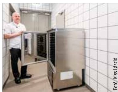
A konyhákat üzemeltető Városgondnokság és az Alba Bástya együttműködésének köszönhetően az ételeket ellenőrzött körülmények között olyan családoknak juttatják el ingyenesen, akik számára ez nagy segítséget jelent

Az Alba Aréna és a Sóstói Stadion éttermeiben az ebédfőzésből és a rendezvényeken megmaradt, még fogyasztható ételeket egy speciálisan erre a célra kialakított hűtőben tárolják. Cser-Palkovics András polgármester az új programot bemutató sajtótájékoztatón örömet fejezte ki az egyedülálló kezdeményezés kapcsán, melynek célja, hogy a megmaradt, de friss és kifogástalan minőségű, ellenőrzött ételekből minél többet megmentsenek.