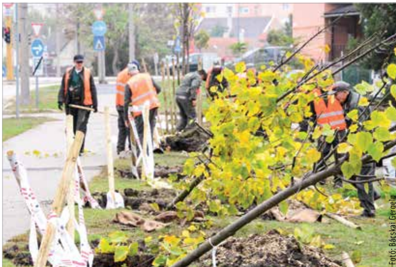
A sikeres pályázók számára szaktanácsot és gondozási útmutatót is ad a Városgondnokság

kapnak a pályázók, de cserjéket és vadszőlőt is most lehet kérni a társasházi kukaketrecekhez. Azok jelentkezését várják, akik vállalják, hogy minimum három évig gondozzák az általuk elültetett facsometét. A pályázati felület már megnyílt, jelentkezni június tizenegyedikéig lehet a lombkoronásszékesfehérvár.varosgondnoksag.hu oldalon, ahol a pályázattal kapcsolatos részletek is olvashatók.