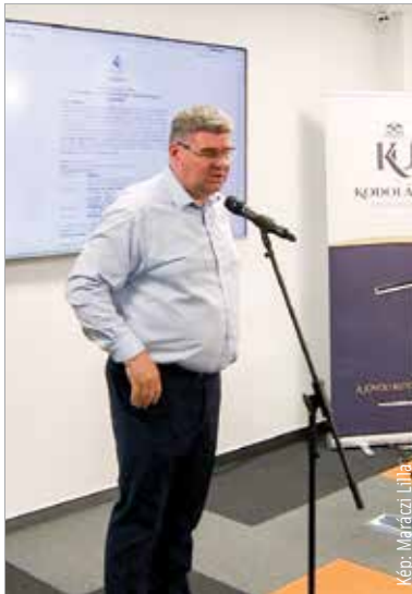
A projekt Mezőföld gyengeségeit, erősségeit, kihívásait is vizsgálja