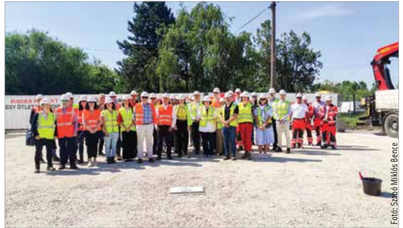
Az oktatási központban helyet kapnak olyan technikai eszközök és munkagépek is, amelyek a cég gépparkját szimulálják