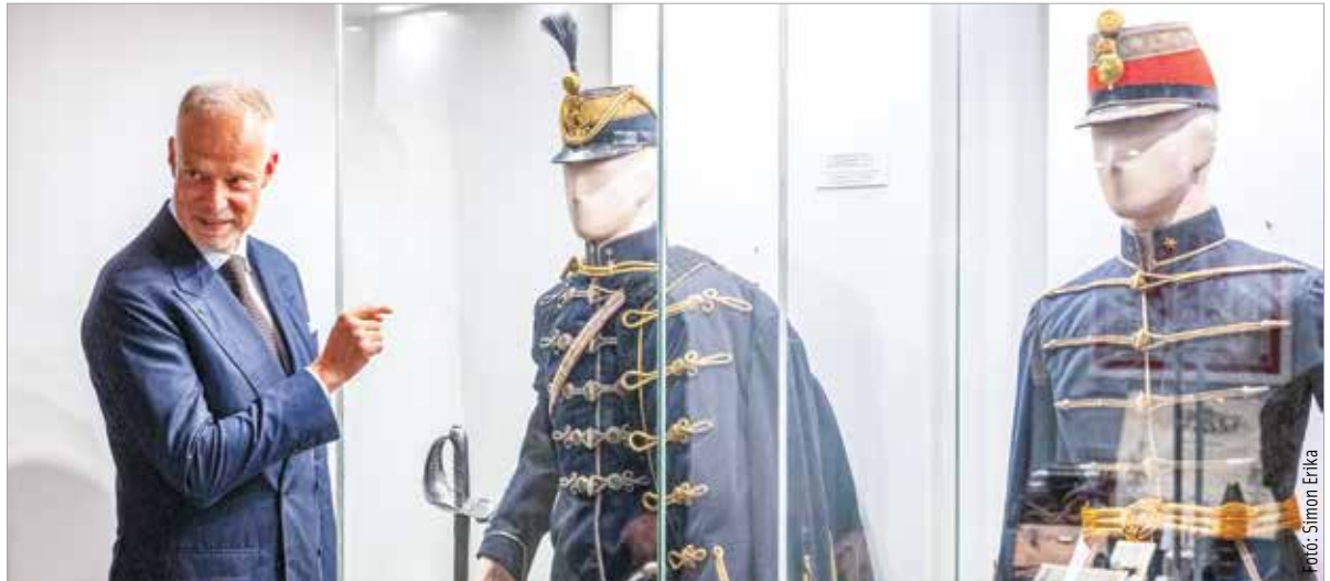
Pénteken megnyílt a magyar hadtörténet évszázadainak emlékeit felvonultató kiállítás a múzeumban

A Hadtörténeti Intézet és Múzeum különleges gyűjteményébe enged bepillantást a Hadimustra – A magyar hadtörténet évszázadainak emlékei című kiállítás, mely egy évig látható a múzeum Rendház-épületében. A tárlat bepillantást nyújt a magyar hadtörténet elmúlt évszázadaiba, az oszmán uralom elleni küzdelemtől napjaink honvédségének fegyverzetéig. A péntek délutáni ünnepélyes megnyitó előtt már számos kísérő-programmal várták az érdeklődőket: katonai hagyományörzők, valamint a modern hadsereg katonái is bemutatót tartottak. A programot a Székesfehérvári Helyőrségi Zenekar látványos felvonulásai és zenés produkciói színesítették. Az ünnepélyes megnyitót Szalay-Bobrovniczky Kristóf tartotta. A honvédelmi miniszter a jelenkor kihívásairól szól, hangsúlyozva a