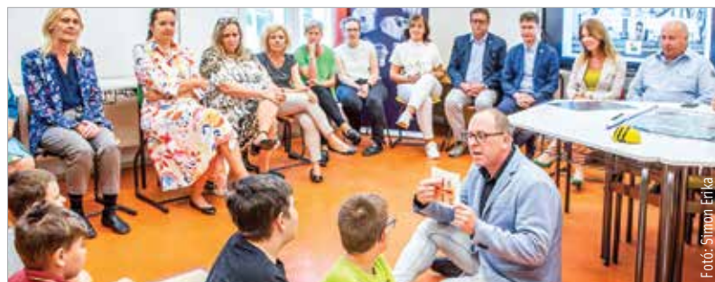
A pedagógusok képzése a teljes tanévet átölelte: összesen öten készültek fel az Alba Innovárnak köszönhetően, hogy a digitális eszközök használatát minden tantárgyba be tudják illeszteni