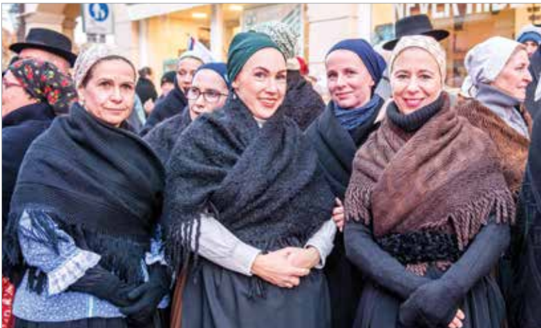
A mulatságban a Tilinkó Zenekar és az Alba Regia Táncgyűttes szeniorjai, valamint a Sziget Néptáncgyűttesület, a ráckevei Rózse Táncgyűttes és a Vasas Művészyűttes Tánckarának Obsitos csoportja is közreműködött