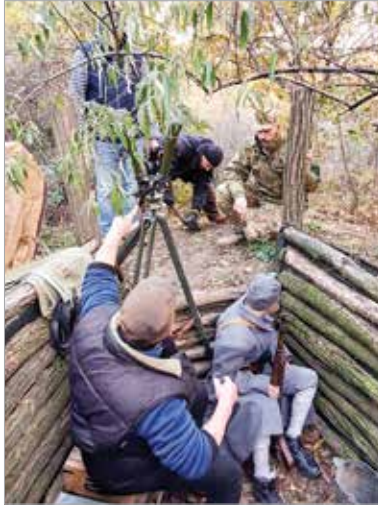
Nemrég a pákozdi Mészeg-hegyre költözött a stáb, ahol a küzdelmet a lövészárkokban idézték fel korhű fegyverekkel, szakértők segítségével