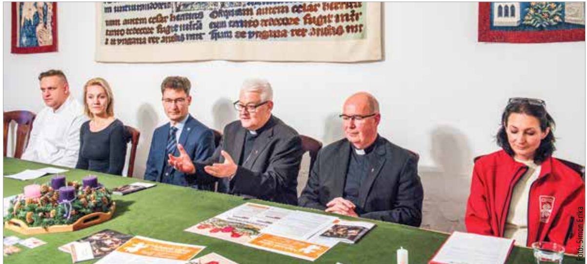
A Katolikus Karitászmunkatársai a Gyűjts éltető fényt! és az Egymillió csillag a szegényekért adománygyűjtéseit, jótékonyági akcióit mutatta be