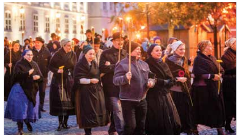
A program a Liszt Ferenc utca után a Táncháztanulóban folytatódott, ahol Katalin-bált rendeztek