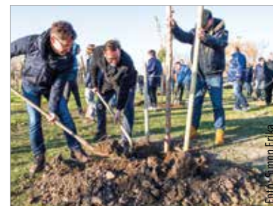
Cser-Palkovics András polgármester Viza Attila önkormányzati képviselővel ültette el az első fát

A palotavárosi tavaknál folytatódtak a faültetések Székesfehérváron: ezúttal az északi részen fiatal juharfákat ültet el az önkormányzat a Howmet-Köfém Kft. székesfehérvári gyárával közösen. Cser-Palkovics András elmondta, hogy a Howmet egy évfordulóhoz kapcsolódóan álmodta meg a kezdeményezést: „Hetvenöt évvel ezelőtt Amerikában, Cleveland városában elindított a jogelőd cég egy technológiai újdonságot: alumíniumtárcsák előállításával kezdtek foglalkozni. Ez egy szép születésnap, ezen apropóból történtik Székesfehérváron a faültetés.” A polgármester hozzátette: a Városgondnokság szakemberei a Howmet dolgozóival közösen hetvennégy fát a palotavárosi tavaknál, egyet pedig a fehérvári gyár területén ültettek el. „Ezt a hetvenöt éves évfordulót