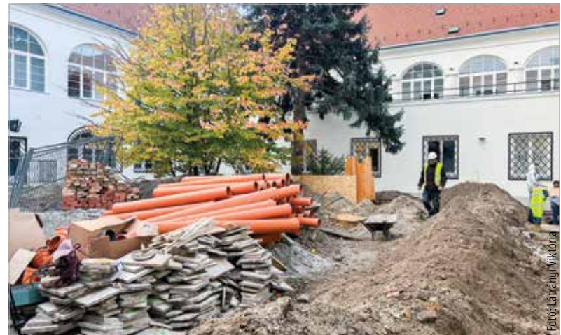
A Városháza díszudvarának rekonstrukciója szeptember végén kezdődött

és egy várfalszakaszt talált, valamint egy csatorna részletét. Azóta nem történt komolyabb kutatás ezen a területen.