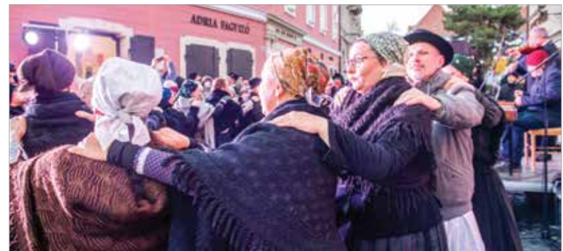
A jelenlévők zenével és tánccal szórakoztatták magukat és közönségüket