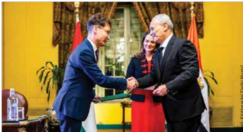
Cser-Palkovics András és Mosztafa Alham, Luxor kormányzója Novák Katalin köztársasági elnök jelenlétében írta alá a két település testvérvárosi szerződését Egyiptomban

A polgármester a látogatással kapcsolatban úgy fogalmazott: nagy megtiszteltetésnek tartja, hogy helyi tisztségviselőként az államok közötti diplomácia részese lehet.