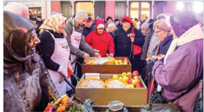
A hideg ellenére is megtelt a Liszt Ferenc utca és Kati néni szobrának környéke