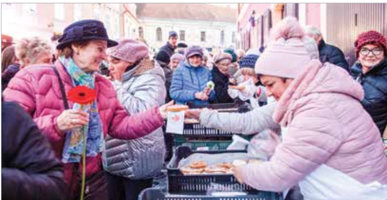
A Hagymányos Piacokért Egyesület és a Fehérvári Polgárok Egyesülete látta vendégül a megjelenteket zsíros kenyérrrel, forrált borral, meleg teával, valamint almával és a hagyományos, felsővárosi savanyú káposztával