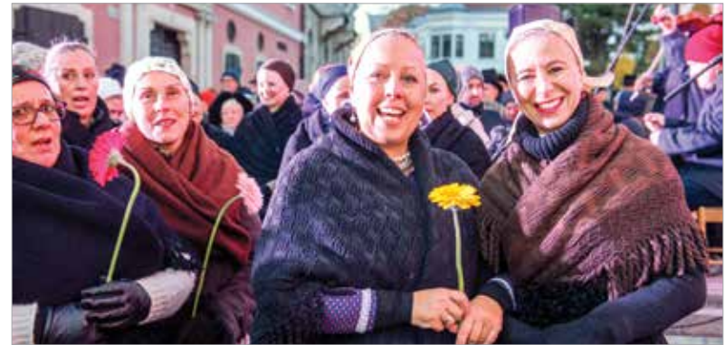
Az ünnepelteket virággal köszöntötték