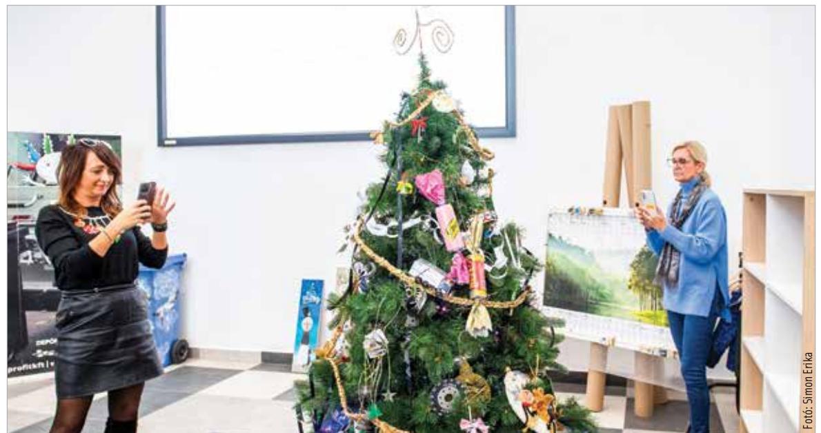
A közös karácsonyfát újrahasznosított tárgyakkal díszítették az önkormányzati cégek munkatársai