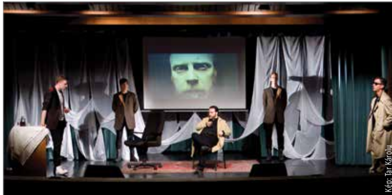
A feszültség a darabban minden pillanatban tetten érhető

főpap szavakkal szétzúzni egy fennálló rendet, Caligula parancsát, felébredhet-e a helytartóban a kétely? Mert ha igen, nemcsak e rend omlik össze, hanem egy megingathatatlannak vélt ember, Petronius is.