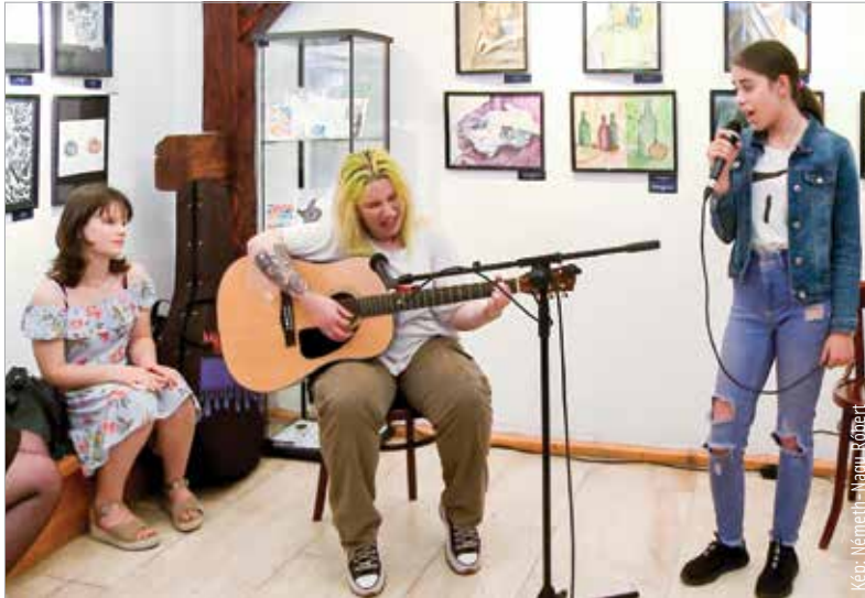
Az iskola büszke lehet a művészpálántáikra!