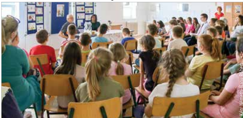
A Táncsics Mihály Általános Iskola vendége volt napjaink egyik legendás magyar írója, Nemere István. Az író-olvasó találkozón Bokros Judit újságíró moderálása mellett ismerhették meg a diákok népszerű szerző írói hitvallását.