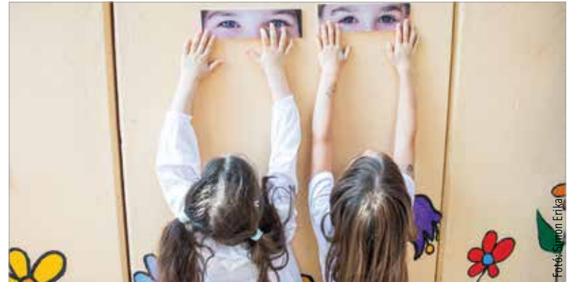
Az óvodát fenntartó alapítvány nem először indít fotózással kapcsolatos projektet: tavaly tavasszal négy évszak képeit gyűjtötték össze amatőr fotósoktól, majd több kiállításon is bemutatták a közönségnek

A sok mosolygó szempár az itt töltött boldog időt jelzi az érkezőknek – mondta el köszöntőjében Mészáros Attila alpolgármester, majd hozzátette: „A város nagyon büszke lehet óvodáira, mind az önkormányzati, mind a más fenntartású intézményekre! Mindegyik másban jó és másban fejlődik.”