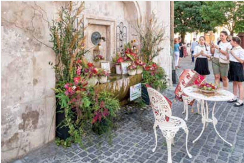
A Török kút díszítése igen népszerű volt a járókelők körében

Székesfehérváron már hagyományra vált, hogy a pünkösdi hosszú hétvégére virágba borul a város, és a járókelők megcsodálhatják a virágüzletek alkotásait. Aki pedig a belvárosban járt, nemcsak gyönyörködhetett a virágokban, hanem meg is vásárolhatta azokat, idén is megtartották ugyanis a virágárverést. A befolyt összeget a