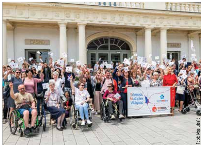
Az SM-betegek a világnap zászlóit magasba emelve üzentek az itthon és világszerte élő sorstársaiknak

ramját a Magyar Neuroimmunológiai Társaság együttműködésével alakították ki. Az esemény fővédnöke Cser-Palkovics András, Székesfehérvár polgármestere volt, aki elmondta: a világnap egy jó lehetőség arra, hogy felhívjuk a betegségre a figyelmet, és megadjuk a lehetőséget a szakembereknek, hogy az érintetteknek és családjuknak olyan tudást és információt adjanak át, ami könnyebbé teheti a betegség elfogadását, elviselését és az azzal való együttélést.