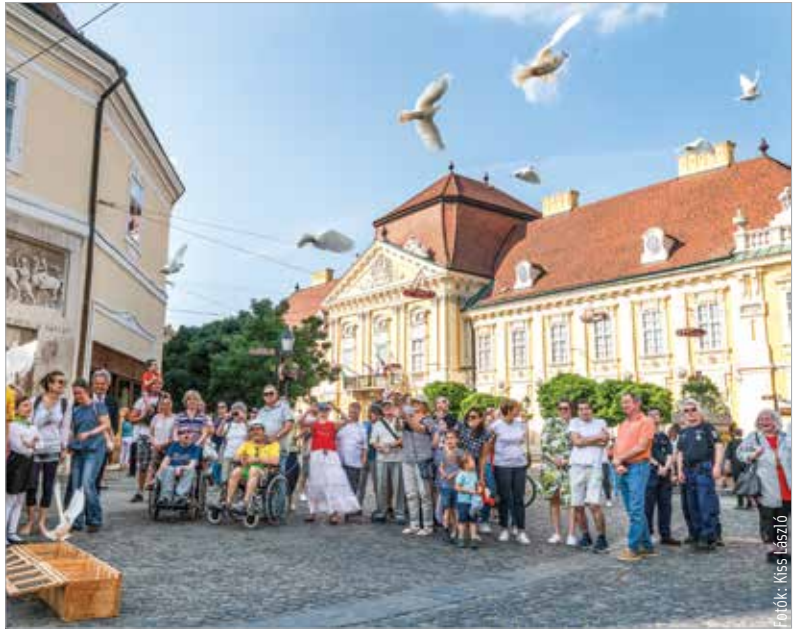
A virágkötők hat helyszínen alkottak: az Országalma, a Városháza, annak Díszudvara és a Püspöki Palota kapuja mellett a Török kútnál és a Szent István Király Múzeum Rendházépülete elé is készültek kompozíciók

kórház csecsemő- és gyermekosztálya támogatására ajánlotta fel a város. Az esemény megnyitóján ezúttal