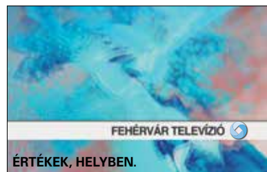
FEHÉRVÁR TELEVÍZÓ ÉRTÉKEK, HELYBEN.