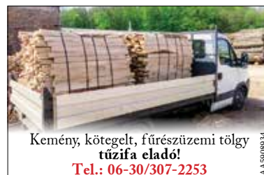
Kemény, kötögetelt, fűrészüzemi tölgy tűzifa eladó! Tel.: 06-30/307-2253

aranszínű anyagot a vár több pontján is elhelyezik majd, ezekre pedig mindenki saját üzeneteit, alkotásait ráírhatja, rárajzolhatja. A Százoszlopos udvarban és az Elefánt udvarban minőségi zenét hallgathatnak, a Vagyóczy-teremben pedig Nagy Bogi festményeit is megcsodálhatják az érdeklődők. Ekkor lesz látható először a Bory-vár új díszkivilágítása is.