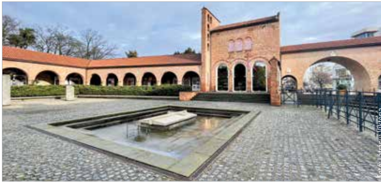
A nemzet történelmi bölcsőjének sorsa sokakat foglalkoztat. A cél egy méltó emlékhely kialakítása.

Először a Székesfehérvárt érintő változásokról, fejlesztésekről kérdezték előben a fehérváriak a polgármestert a Köztér Extra című műsorban. A nemzet történelmi bölcsőjének sorsa, a Nemzeti Emlékhely jövője sokakat foglalkoztat, hiszen a cél közös: egy méltó emlékhely kialakítása. „Kijelenthetjük, hogy mai állapotában a Nemzeti Emlékhely nem méltó ahhoz a történelmi múlthoz, ami ehhez a helyhez kapcsolódik. A Nemzeti Emlékhely nemzeti történelmi bölcsője. Az, hogy mi most magyarul beszélhetünk, jelentős részben ennek a helynek köszönhető, ami több mint ötszáz éven át lehetővé tette Magyarország számára államiségének fenntartását. Az ügyben már eddig is sok minden történt. Elindult például a sétány kialakítása, már készül a kőtár és a látogatóközpont az egykori Köztársaság mozi épületében, aminek a felújítása hamarosan befejeződik.