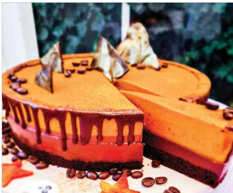
Vegán kávés-fahéjas-sütőtökös csokitorta

A krém hozzávalóit összeturmixoljuk, majd szétterítjük a pitén. Ha marad tészta, akkor lehet belőle díszítés a tetejére. Amikor minden kész vagyunk, a pitét betesszük a 170 fokra előmelegített sütőbe, majd alsó-felső sütéssel körülbelül harminc percig sütjük.