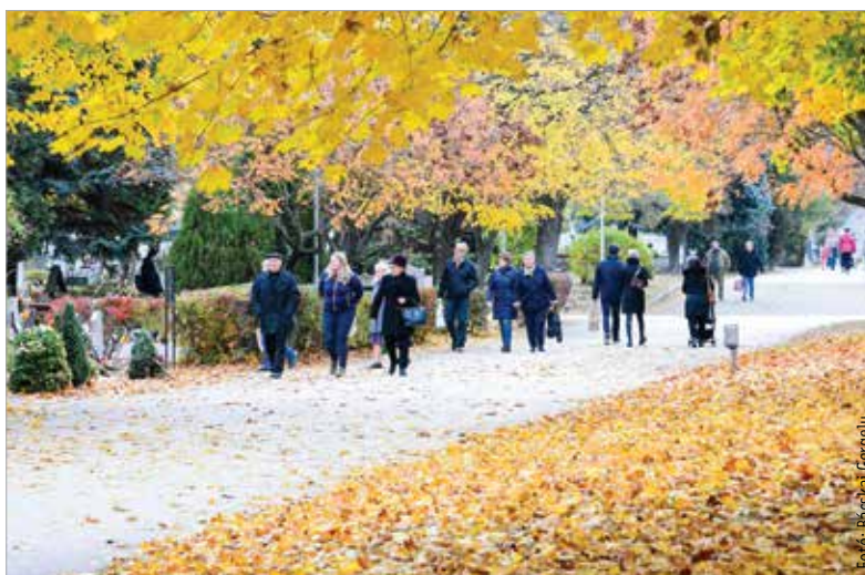
Több intézkedés is segíti a temetőlátogatók békés megemlékezését

A Béla úti köztemető területén ingyenesen lesz használható az elektromos kisbusz, ami október 30-án, 31-én és november 1-jén 9 órától 18 óráig folyamatosan közlekedik, igazodva mind a három