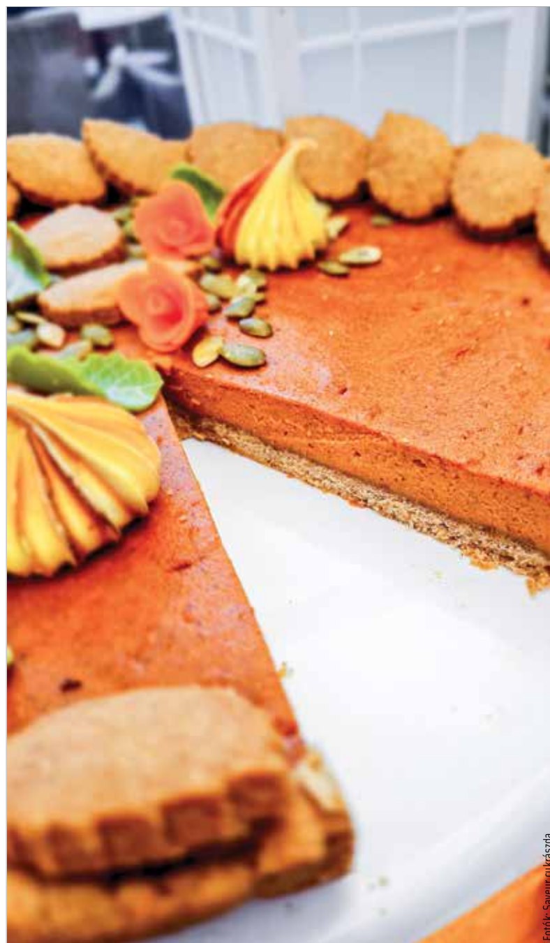
Cukormentes sütőtökös pite