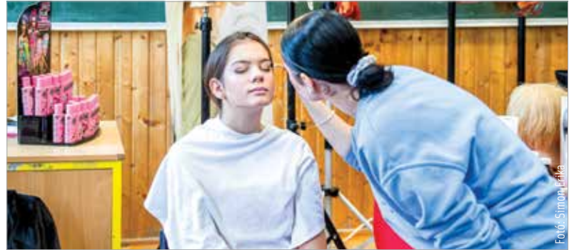
A palettáról a szépségipari szaktmák sem hiányoztak

lalkozókedvűek egy úgynevezett ambulaba segítségével. A pályaválasztási kiállítást a Fejér Megyei Kormányhivatal szervezi meg évről évre, hogy segítséget nyújtson a diákoknak a döntés során. Idén ötvenhat kiállító, iskola, valamint munkáltató várta a fiatalokat. Simon László főispán a választás jelentőségéről beszélt, míg Mészáros Attila alpolgármester arra hívta fel a figyelmet, hogy Székesfehérvár egy teljes életpályamoddellel szolgálhat mindenkinek a bölcsődétől egészen az egyetemig, sőt a munkahelyig. A pályaválasztási kiállításon a diákok úgy ismerkedhettek meg az intézmények képzési kínálatával, hogy beleszólhattak az adott tudományterület jellemző tevékenységeibe.