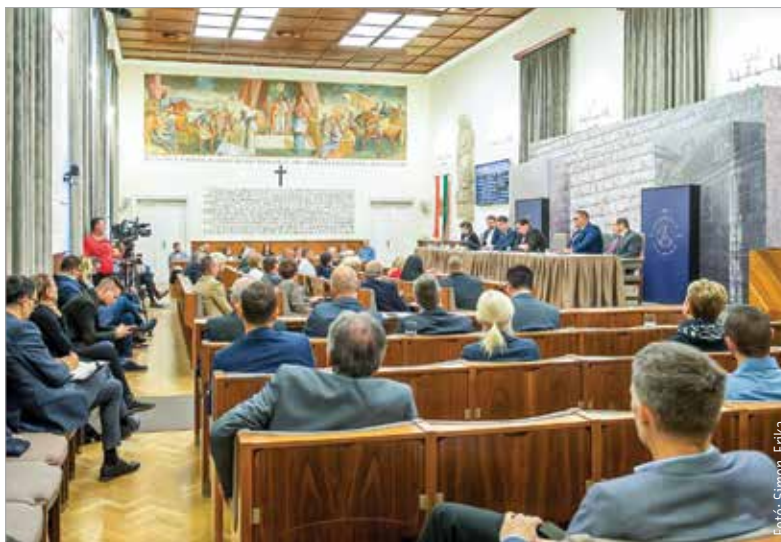
Elfogadták a képviselők az elmúlt hetekben lefolytatott egyeztetések és a megjelent szabályozások ismeretében összeállt javaslatcsomagot, mely többek között az intézmények, létesítmények nyitvatartását szabályozza

4 Évszak kincsei • Berényi út 5. + 36 30 703 6744