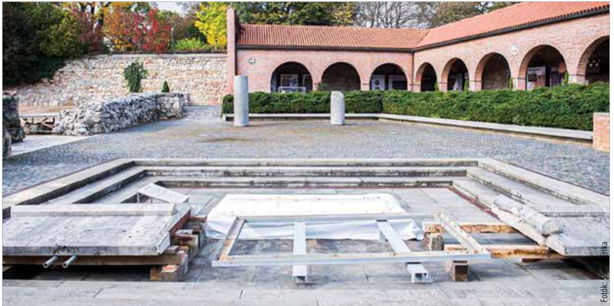
Korszerűsítik az osszárium fedlapját a Nemzeti Emlékhelyen

„Eddig az osszárium fedlapjának mozgatásához – annak súlya és szerkezete miatt – külső segítséget kellett bevonni. Ennek költsége jelentős terhet jelentett, így most olyan megoldást