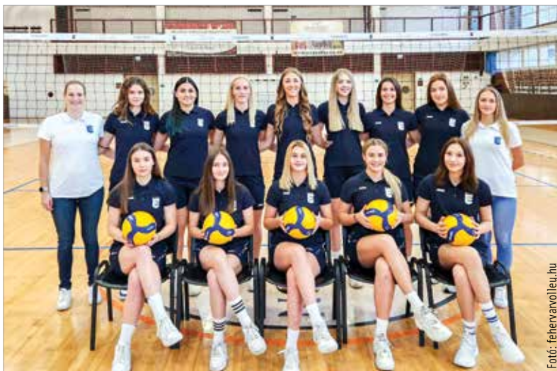
Kemény feladat vár a bajnoki rajton a fehérvári röplabdás lányokra