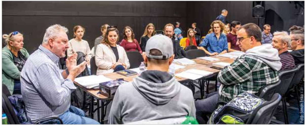
A legnépszerűbb Beatles-slágeret hallhatjuk majd nagyzenekari feldolgozásban