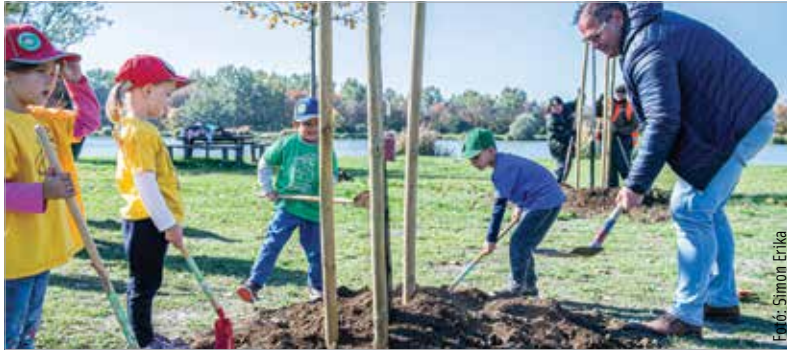
Az óvodások is kivették a részüket a munkából