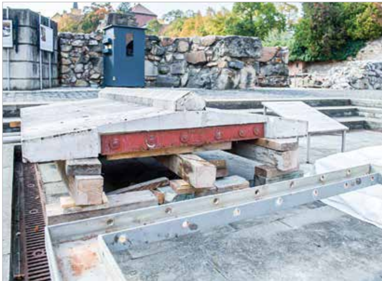
A fedlap szétszedésekor kiderült, hogy elkorhadtak a párnafák, ezeket is cserélik