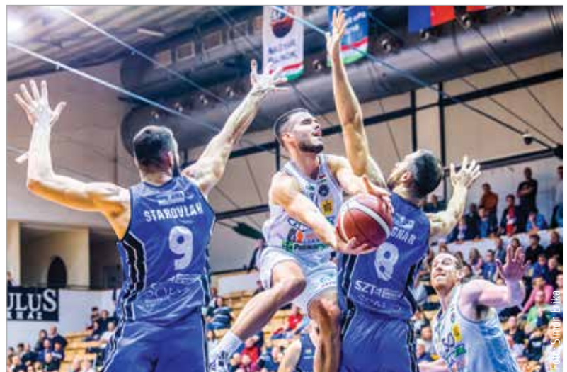
Ahogy Takács Milánnak, úgy az Albának is meg kellett szenvednie a szegediek ellen

kényszerítették a szegedieket, és ötven másodperc alatt eltüntették hátrányukat a hazaiak. A hosszabbítást pedig újabb tíz ponttal nyitották, így végül ritkán látható fordítással megnyerték a meccset. A nyitófordulóban elszenvedett paksi vereség után így háromszor nyert zsinórban az Alba, de nem véletlenül nyilatkozta Isaiáh Philmore, hogy csak a meccs végén volt igazán megfelelő a küzdés és a figyelem. A jó sorozat folytatásához negyven percre kell kiterjeszteni ezt a játékot, már legközelebb, szombaton, a Kőrmend otthonában is.