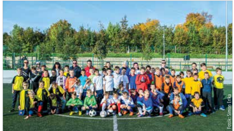
Hat csapat mérkőzött meg az idei kupán