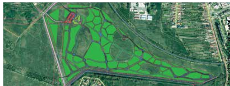
Földes és murvás sétányok lesznek majd az új erdőben

A kivitelezés ugyan befejeződik 2023 végére, de néhány év és megfelelő gondoskodás szükséges lesz még ahhoz, hogy igazán szép szabadidőparkká alakuljon a terület.