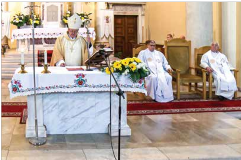
Spányi Antal méltatta Prohászka Ottokár munkásságát

a nagy előd ma is üzenetértékű munkássága, tanulságos, előremutató gondolatai előtt. Spányi Antal beszédében kiemelte, hogy Prohászka Ottokár, a nagy hatású igehirdető és gyóntató, a távlatokban gondolkodó főpap, lelki író elkötelezett élete vitán felül áll, a jelen és a jövő nemzedéke számára is példa kell, hogy legyen. A szentmisét követően a megemlékezés résztvevői megkoszorúzták a püspök sírját, majd síremlékénél közösen imádkoztak Prohászka Ottokár boldoggá avatásáért és közbenjárásáért.