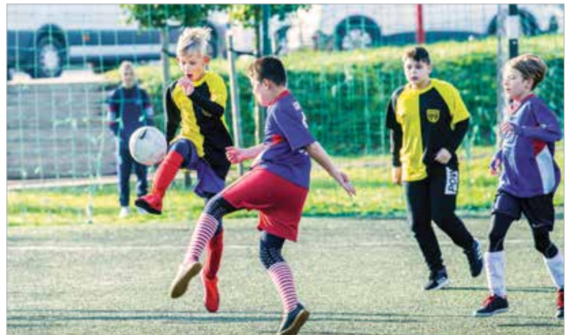
Mindenki komolyan vette a meccseket

egészségügyi szűrésen, általános állapotfelmérésen és életmód-tanácsadáson is részt vehetett bárki. A kupán a harmadik helyezést a Zentai Úti, a másodikat a Hétvezér Általános Iskola érte el, míg az első helyen a Széna téri Általános Iskola csapata végzett.