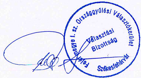
Dr. Pallos István Bizottság elnöke

A Bizottság határozata a választási eljárásról szóló 2013. évi XXXVI. törvény 46-47. §-án, 132. §-án, 294. § (2) bekezdésén, valamint az országgyűlési képviselők választásáról szóló 2011. évi CCIII. törvény 13. §-án és 15. §-án alapul. A jogorvoslati lehetőségről szóló tájékoztatás alapja a Ve. 221. §-a és 223-224. §-ai, 241. §-a.