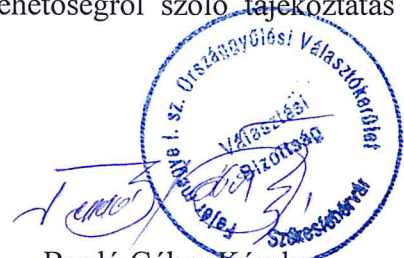
Berdó Gábor Károly Bizottság elnöke