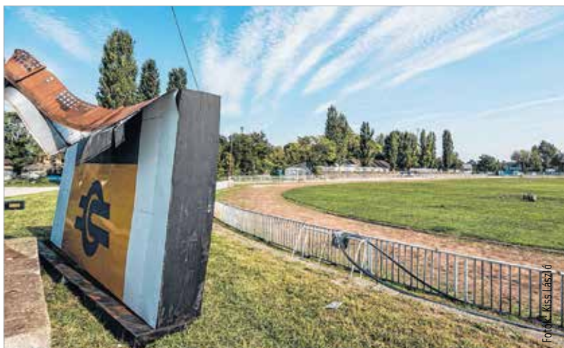
Valami Amerika... lesz majd itt nemsokára

helyett a Fehérvár Enthroners és az amerikai futball találhat itt új otthont magának. A munkagépek már dolgoznak, a tervek szerint tavaszra elkészül az első hazai szabvány, vagyis 120 yardos pálya, és felújítják az öltözőket. Ehhez az is kellett, hogy a terület önkormányzati tulajdonba kerüljön. Előreláthatólag 2017-ben fejeződik be a teljes fejlesztés, amelynek keretében az itthon is egyre népszerűbb amerikai foci