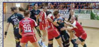
Egyszer lenn, egyszer fenn 14. oldal