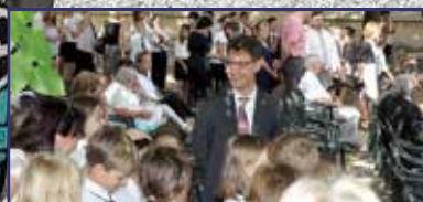
Domborműavató ünnepség a Rákócziiban 12. oldal