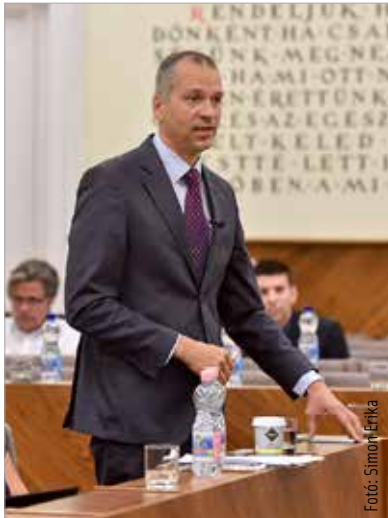
A baloldali frakció is támogatta a fideszes előterjesztést a katonák és rendőrök megsegítésére

Pénteki ülésén Székesfehérvár Önkormányzata első napirendi pontként döntött arról, hogy tízmillió