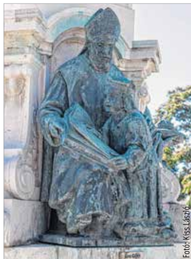
Szent Gellértet, a magyar keresztény tanítók példaképét Bory Jenő is megformálta a Püspökút emlékoszlopon, amely a Piac téren található