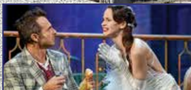
Csókos asszony – szívünkbe zártuk 5. oldal