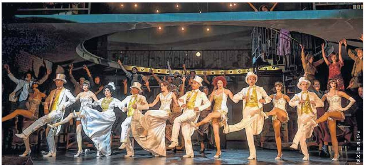
Az örökzöld slágerek mellett rengeteg tánc, nevetés és egy remek történet várja a publikumot a Vörösmarty Színházban

Pünkösdi Kató – Töröcsik Franciska Tarpataky András báró – Hirtling István Dorozsmai Pista – Keller János