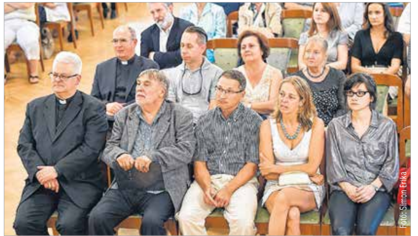
„Az élet minden területén szükség van igazi keresztény emberekre”

„Olyan családból származom, ahol a katolikus hit, az egyházzal való kapcsolat gyermekkoromtól megvolt. Úgy érzem, a munkáimon keresztül ez tükröződik. Hívó katolikus családból jöttem, és úgy gondolom, hogy azok a munkák, amiket Székesfehérváron is bemutathattam, mélyen tükrözik hitvallásomat. Nagy megtiszteltetés számomra, hogy kiállíthatok az Ars Sacra Fesztiválon, hogy ezeket a műveket, amelyek valamilyen szinten reprezentálják gondolkodásomomat, elhozhattam ide Szent István városába.”