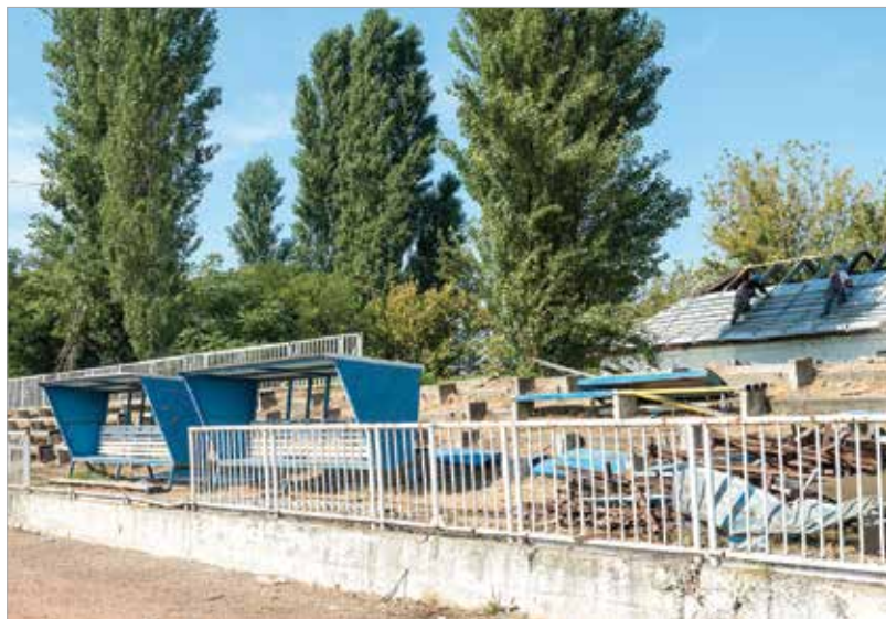
A romokat már takarítják, hogy új sportnak hódolhasson a fehérvári közösség

stadionját és egyik legmodernebb magyarországi edzőközpontját is létrehozzák. „Székesfehérvár Önkormányzata teljes mértékben elkötelezett abban, hogy a MÁV-pálya rendezését biztosítsa. Szeretnénk elérni, hogy minél több Székesfehérváron meghonosodott, valódi közösséget létrehozó sportágnak saját otthona legyen” – indokolta