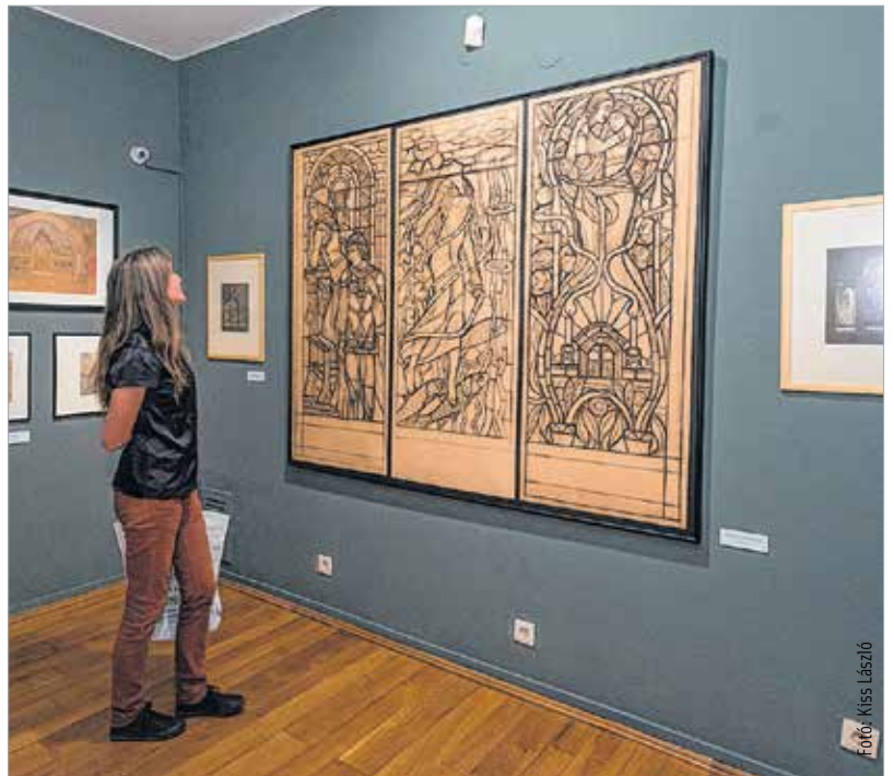
Megnyílt Nagy Sándor életmű-kiállítása a Városi Képtárban. A gödöllői szecesszió kertje című tárlat a 2015-ös év legkiemelkedőbb történeti, képzőművészeti kiállítása Székesfehérváron.

A tárlat városunkban a 2015-ös év legkiemelkedőbb történeti, képzőművészeti kiállítása. Az európai mércével mérve is jelentős magyar szecessziós művészet megteremtésében, a gödöllői művésztelep létrehozásában és fenntartásában Nagy Sándor meghatározó szerepet vállalt. „Változatos és következetes életművében a festészeti és grafikai alkotások mellett könyvillusztrációkat, bőrtárgyakat, egyházi és világi textileket, ablakfestményeket és freskók terveit is megtaláljuk. A