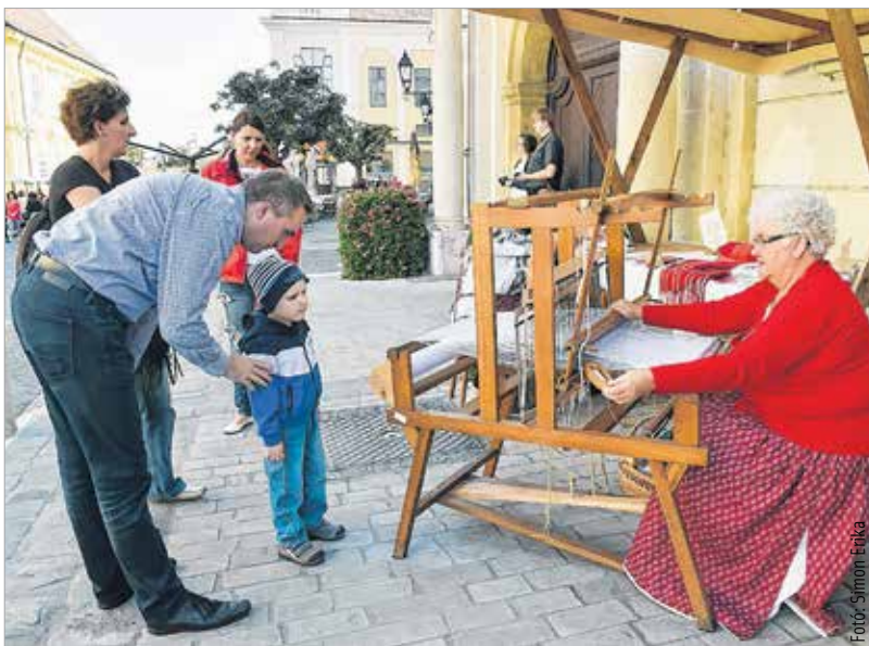
A Civil Napon a kézműves mesterségek képviselői is jelen voltak

a lakosságnak. Az élet legkülönbözőbb területein tevékenykedő, összesen harmincnégy szervezet csatlakozott a programhoz. A Civil Napon szerepeltek a családokat, a közösségeket támogató egyesületek, kézművesek, sportegyesületek, állat- és természetbarát szervezetek, az elfogadó, toleráns és nyitott társadalmi attitűdöt szorgalmazó, a fogyatékkal élőket támogató szervezetek, továbbá a kulturális és tudományos értékeket közvetítő csoportok, akik interaktív módon mutatták be mindennapi tevékenységüket.