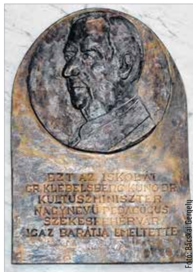
Az egykori kultuszminiszter domborművének reprodukciója

Az egykori vallás- és közoktatásügyi miniszternek köszönhetően építették fel a mai II. Rákóczi Ferenc Magyar-Angol Két Tanítási Nyelvű Általános Iskola épületét. Klebelsberg Kunó az iskola jogelődjének felépítésére négyszázezer pengőt folyósított. Az 1932-es beköltözésük az intézmény a miniszter nevét vette fel. Tiszteletére 1938-ban domborművet avattak, melyet Lux Elek szobrászművész alkotott, a II. világháborúban azonban ez megsemmisült. A II. Rákóczi Ferenc Általános Iskola udvarán felnöttek és gyerekek az intézmény fennállásának 95. évfordulója alkalmából Klebelsberg Kunó tiszteletére ismét domborművet helyezhettek el az intézmény falán. A reprodukció Szakál Antal keze munkáját dicséri. Cser-Palkovics András köszöntőjéből kiderült, pár embernek köszönhetően fény derült arra, hogy ennek az iskolának a falán egykor állt egy Klebelsberg-dombormű, amiről sokáig a város vezetősége nem is tudott, hiszen még azok a dokumentumok sem voltak meg, amelyek ezt alátámasztották volna. A lelkes Klebelsberg-tisztelők azonban igazolni tudták,