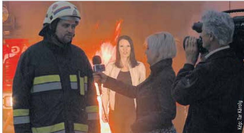
Az új hírműsor szlogenje: Figyelünk! – Minden, ami Fehérvár; Kérdezzünk! – Minden, ami hír; Tájékoztatunk! – Híradó 1-kor minden hétköznap, hogy ön is időben képen legyen!

Minden székesfehérvári eseményre, megoldásra váró problémára reagálunk, és tájékoztatjuk a városban élőket. Éppen ezért az a lényege a délután egykor kezdődő hírműsornak, hogy időben, frissen jusson el az információ mindenkihez, akár a tv-ből, akár az internetről tájékozik az illető. A korai időponttal a figyelem nem csupán azokra az eseményekre terelődik, amelyekre este, esetleg másnap is hírtértekük van, hanem olyanokra, amelyek aznap kapnak jelentős szerepet. Ilyen például egy útlezárás, egy baleset, de ilyen lehet egy gyors politikai reakció nem várt eseményekre. A kulcs a jelenlét, és az, hogy a néző is nyomon tudja követni a városban történteket a napközbeni események ismeretében.