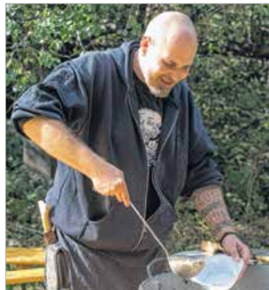
A Koppány-napi kondérban gyümölcsös-húsos ragu főtt – hasonló ételt a korabeli vadászó, gyűjtőgető magyarok is ehettek

A hétvégén ideális idejük volt a Zöld tanyára látogatóknak, akik kirándulásokkal, növénygyűjtéssel és különböző hagyományörző tevékenységekkel mondtak igent a természet hívására. A gyermekek íjzhattak, növényt gyűjthettek, és megismerhették, milyen volt ősünk lakhelye, a jurta. Aki pedig megéhezett, egy különleges bográcsban főtt ételből kóstolhatott.