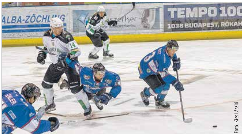
A Fradi játékosai (fehérben) nagyobbak voltak, a fehérváriak fűgébek