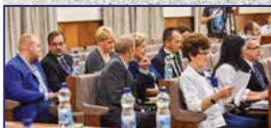
Támogatás a határ őrzőinek 2. oldal