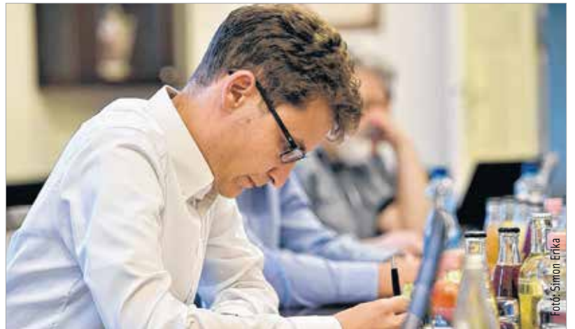
A legtöbb kérdés a Várkörúttal és a közösségi közlekedéssel kapcsolatban érkezett

teljes felszíni rendszer felülvizsgálata. A legtöbb kérdés a Várkörúttal és a közösségi közlekedéssel kapcsolatban érkezett. Ezekre önálló bejegyzésekkel válaszolt Székesfehérvár polgármestere, amelyekből kiderült, hogy a Várkörút esetében kifejezett cél volt a történelmi belváros tágítása és az autós forgalomtól való tehermentesítés. Emellett fontos az is, hogy előnyben részesítsék a gyalogos, a biciklis és a közösségi közlekedést. Ez utóbbival kapcsolatban elkészült a javaslat az új buszhálózat kialakítására, amit néhány héten belül bemutatnak a város honlapján valamint lakossági fórumokon. Ennek társadalmi vitája a napokban elkezdődik.